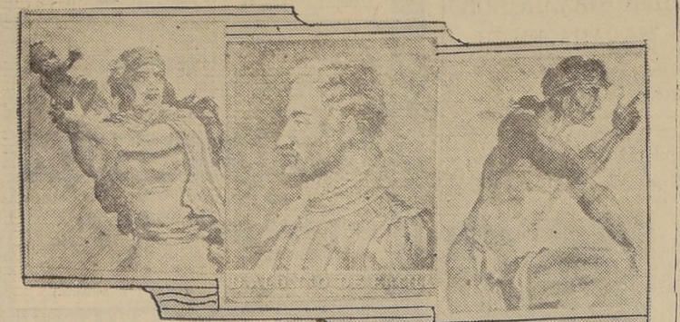
Algunos de los grabados que ilustran parte de la segunda Cartilla de Cultura Popular editada por el Departamento de Extensión Cultural. Las imágenes de Alonso de Ercilla y Caupolicán, evocan los tiempos lejanos y heroicos del coloniaje.

DISTRIBUCION GRATUITA A EMPLEADOS Y OBREROS