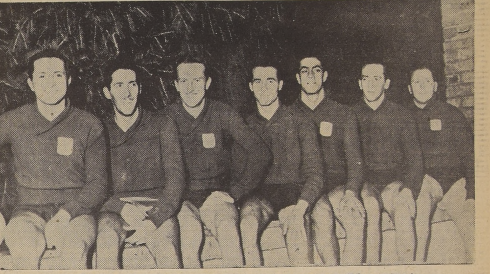
"Seven" de la Unión Española que se adjudicó el título de campeón de Chile en water-polo

OTROS ELEMENTOS DESTACADOS Entre los demás elementos que