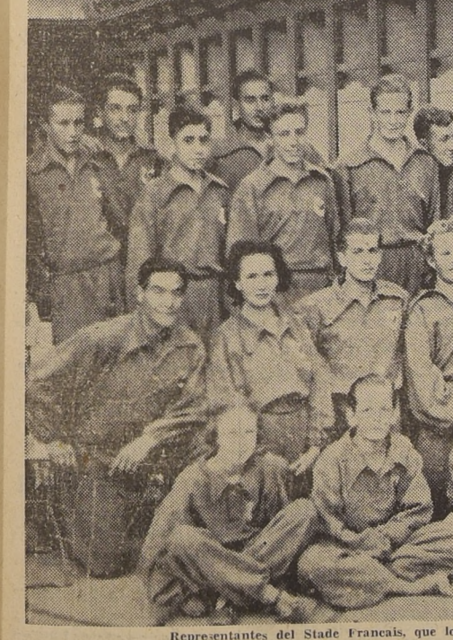
Representantes del Stade Français, que lograron en el festival de ayer lucida actuación

LA A. CENTRAL LAS 19.30 HORAS SE REUNE HOY A Hoy reunirá sus sesiones de directorio y de consejo la Asociación Central de Fútbol de Santiago, en su sede de Huérfanos 1223.