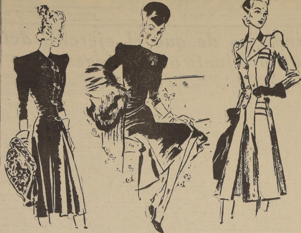
Tres tenidas muy prácticas y elegantes para la próxima temporada de Otoño