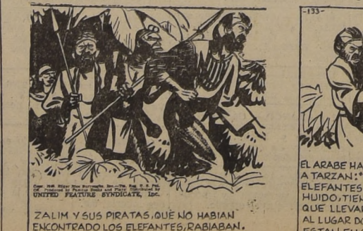
ZALIM Y SUS PIRATAS, QUE NO HABIAN ENCONTRADO LOS ELEFANTES, RABIAN.