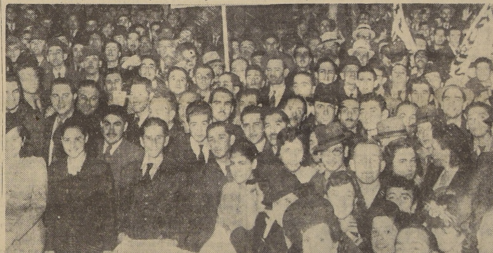
Un aspecto de la gran concentración de ayer de los empleados particulares en la Plaza Bulnes.

Y al hacernos partícipes del entusiasmo colectivo que se desata como característica de este magno acontecimiento gremial, quiero formular mi más calurosa felicitación para los organizadores, los compañeros del Consejo Provincial de Santiago, que no han escatimado sacrificios ni han rechazado sinábolos de toda índole para llevar adelante este comicio, que deja de ser un acto de una forma concluyente y aplastante que la Confederación de Empleados Particulares se ha consolidado como la fuerza genuina y representativa del gremio de empleados de la República.