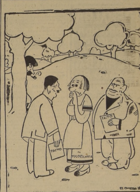
—Señora, os amamos con pasión "balcánica"