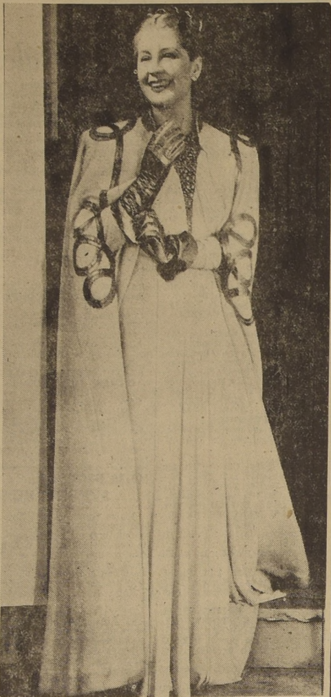
Norma Shearer, Reina y señora de la Pantalla, crea el rol de la Condesa con Robert Taylor, como el amante, en esta adaptación del libro de Ethel Vance.