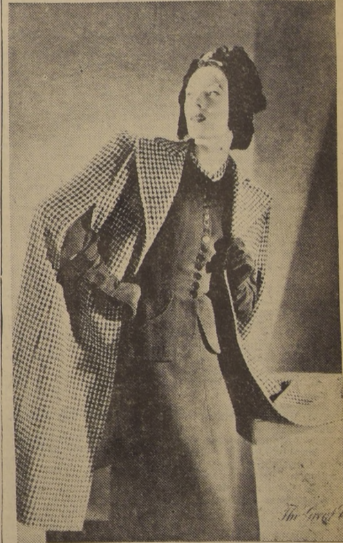
La capa o falda, vuelve nuevamente a ponerse de moda por ser un abrigo práctico y liviano. — La del modelo es de cuadros y se lleva sobre un tailleur de lana negro enteramente abotonada.

"LA QUINTA CALUMNIA", un formidable estreno argentino, el Martes en el Santiago