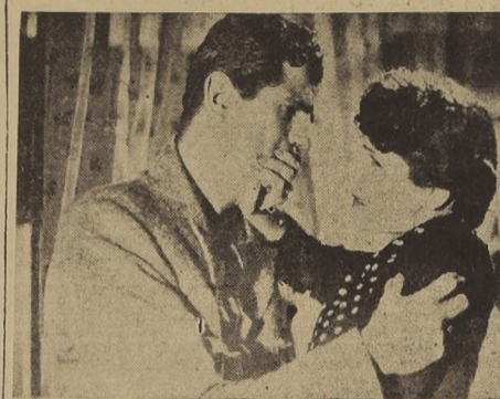
Libertad Lamarque y Floren Delbene, en "Cita en la frontera", producción Argentina Sono Film de carácter extraordinario, que conoceremos en el venidero martes, en las salas Santa Lucía y Continental. Distribuye esta producción la Sociedad Cinematográfica Band y Salas.