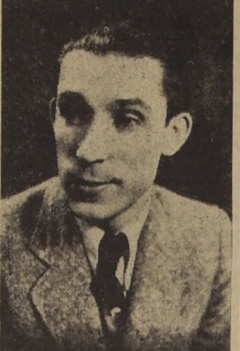
El actor cómico, Pedrin Fernández, que será homenajeado hoy.

Coliseo, y en ella el festejado tiene sketches y ballades de éxito. En la primera parte del programa irá "La marcha del tiempo", que cada día, gusta más.