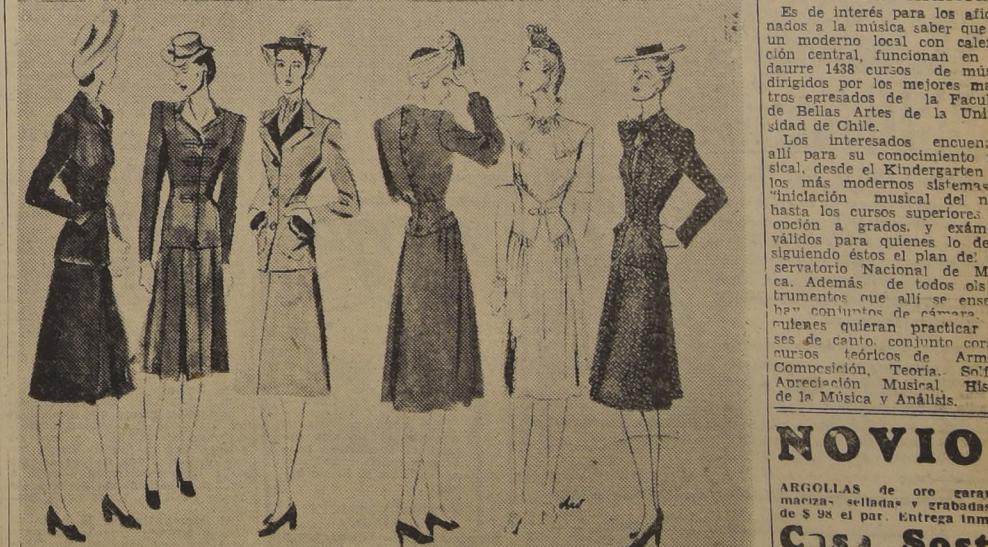
Elegantes modelos que exhiben la nueva línea de la moda que se lucirá durante la actual temporada.