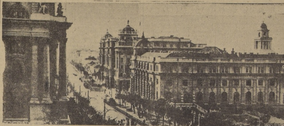
Vista de una parte del sector central de la ciudad de Belgrado

ZURICH 8. (U. P.)—La radio de Berlín anunció esta noche que Belgrado estaba "comple-