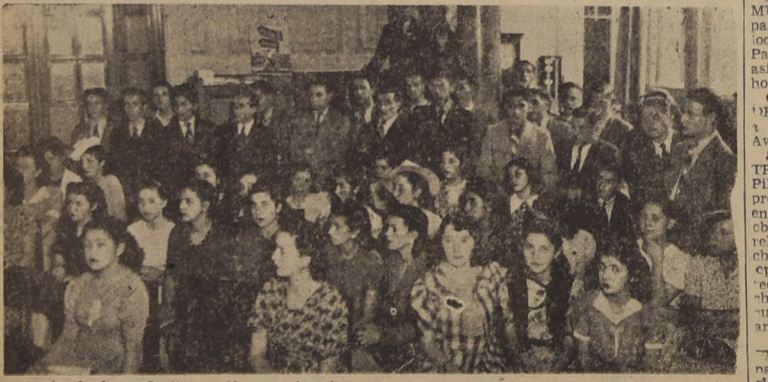
Una parte de las señoras y jóvenes inscritas para los cursos, rápidos de Taquigrafía, Redacción, Matemáticas y Contabilidad, que iniciará esta tarde el Departamento de Extensión Cultural.— Para dichos cursos se están recibiendo las últimas inscripciones

Seguirá su desarrollo el curso de Literatura.— En la próxima semana empezarán los de Matemáticas y Contabilidad.— Últimas inscripciones