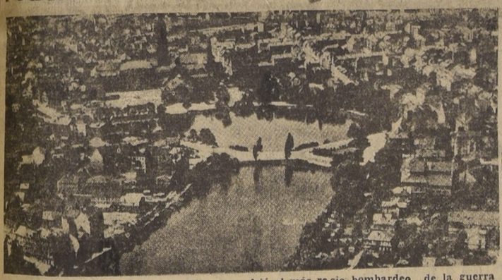
Vision panorámica del puerto de Kiel que sufrió el más recio bombardeo de la guerra

El bombardeo duró cinco horas y fueron arrojados centenares de toneladas de bombas que causaron serios daños en la base alemana