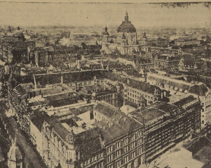
La Real Fuerza Aérea, continuando su tenaz ofensiva, bombardeó la capital alemana, de cuya parte central ofrecemos esta vista.