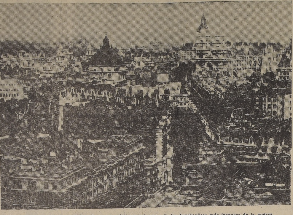
Panorama de la capital inglesa que sufrió anoche uno de los bombardeos más intensos de la guerra.

Pocos instantes después de haberse iniciado el ataque las baterías derribaron a una de las máquinas atacantes. Los reflejos