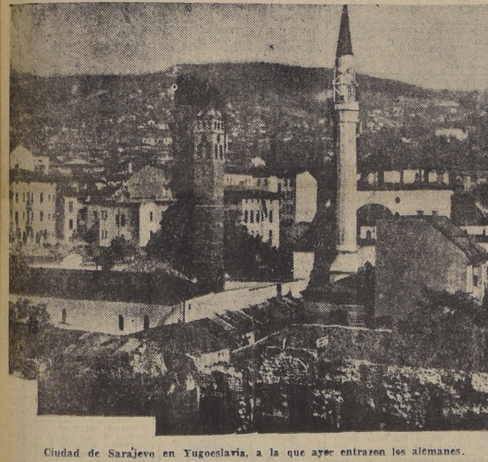
Ciudad de Sarajevo en Yugoslavia, a la que ayer entraron los alemanes.

El ejército yugoeslavo voló el puente del Danubio en el estrecho canal en las Puertas de Hierro, quedando interrumpido el tránsito por el Danubio de Rusia a Alemania, según informaciones de esta zona.