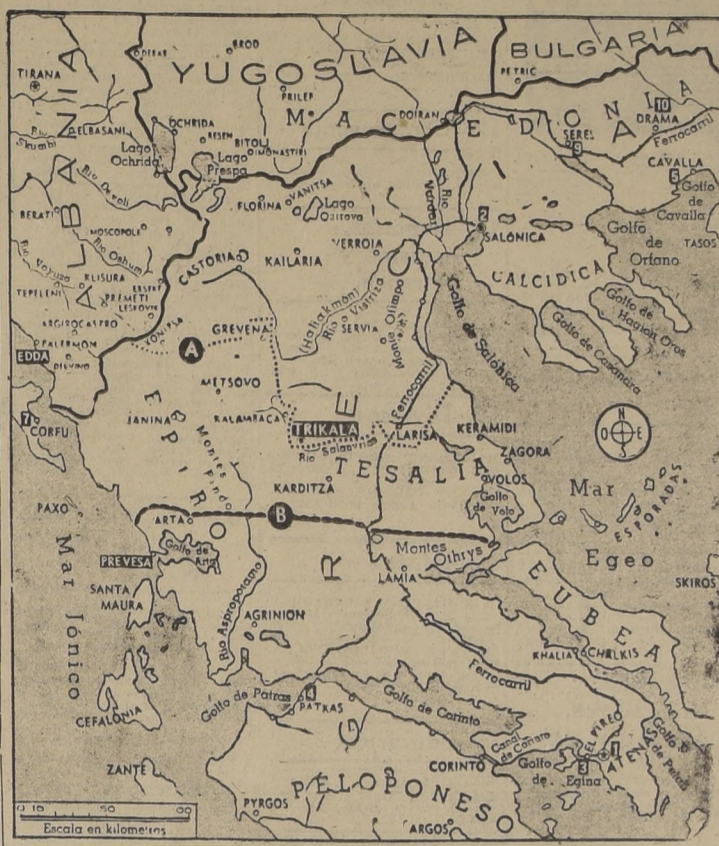
La línea de puntos (A) marca el límite de la zona que ha sido ocupada en Grecia por los alemanes. Con la caída de Janina al oeste, Volos al este, y Lamia al sur, aquella ha sufrido variaciones. Lo mismo acontece con la nueva línea de resistencia griego-británica (B) que ha sido trasladada al sur de Lamia, de acuerdo con las últimas informaciones. Los números indican, por su orden, la importancia demográfica de las ciudades griegas comprendidas en este esquema.

La policía ha puesto agentes de protección a todos los personajes prominentes en ambas zonas, aumentando la vigilancia en tanto que se solucionen el doble misterio.