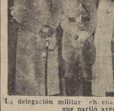
La delegación militar chilena, que partió ayer a Buenos Aires

Por la combinación internacional de ayer se dirigió a Buenos Aires la delegación enviada por las Fuerzas Armadas para representar a la prueba de pentatlón que se realizará como parte del programa del Campeonato Sudamericano de Atletismo.