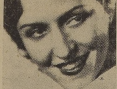
BERTA SINGERMAN que se presentará mañana en el Municipal