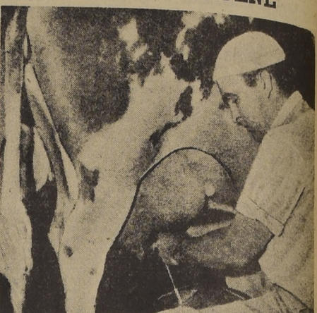
El ordeñar es una operación de importancia.

Ante las diferentes modalidades con que se procede al ordeño de los vacos, es importante que los productores los errores en que se incurrir generalmente.