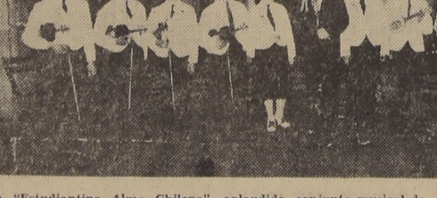
La "Estudiantina Alma Chilena", aplaudido conjunto musical de obreros y empleados, que actuará en su festival de beneficio en el Teatro Chile (al final de Avenida Recoleta), el 30 del presente, a las 21.30 horas.

En la última sesión se hicieron representar nueve Sindicatos locales.— Se designaron Comisiones