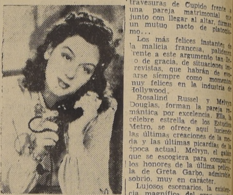
"Eso que llaman amor", la regocijante comedia realizada en los Estudios Columbia y próximo estreno del Teatro Central, ofrece la consagración rotunda de Rosalind Russell y Melvin Douglas.

travesuras de Cupido frente a una pareja matrimonial que junto con llegar al altar, firman un mutuo pacto de platonismo... Los más felices instantes de la película, Rosalind Russell, palidece ante este argumento tan lleno de gracia, de situaciones divertidas, que habrán de permanecer siempre como momentos muy felices en la industria de Hollywood. Rosalind Russell y Melvin Douglas, forman la pareja romántica por excelencia. Ella, la célebre estrella de los Estudios Metro, se ofrece aquí luciendo las últimas creaciones de la época actual. Melvin, el galán que se escogiera para compartir los honores de la última película de Greta Garbo, admirado por su belleza y su carácter. Lujosos escenarios, la extensa y magnífica del set, los aspectos cosmopolitas del vivir moderno, un diálogo preciso, un subtexto musical adecuado, otorgan a "Eso que llaman amor" el título que la crítica mundial le ha atribuido en forma unánime: "La comedia de este año y de muchos años a esta parte".