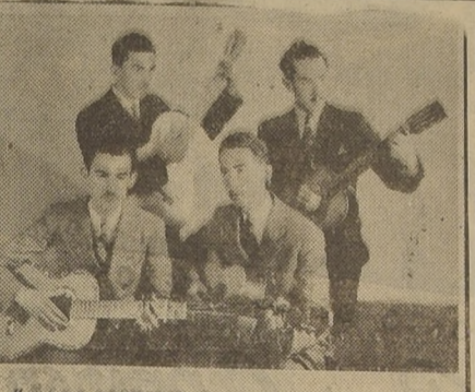
"CUARTETO AMERICA" Notables cultores del cancionero popular brasileño, que harán su debut en C.B. 93 y C.B. 1174 RADIO HUCKE mañana Miércoles a las 22 horas