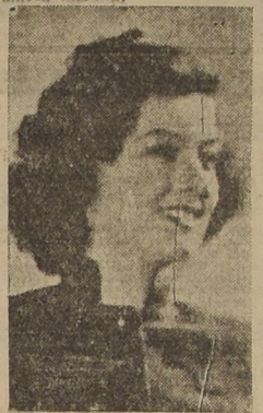
Mirna Loy, que protagoniza la cinta "Te quiero otra vez", secundada por William Powell...