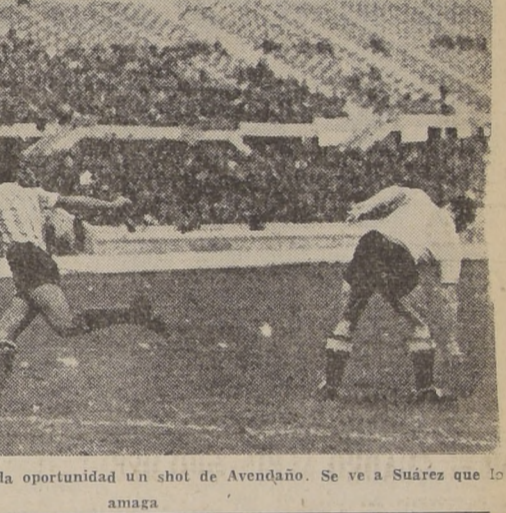
Diano ha embolsado con toda oportunidad un shot de Avendaño. Se ve a Suárez que lo amaga