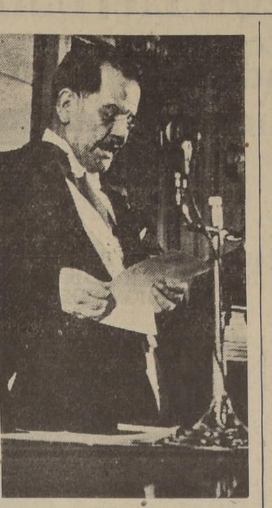
El Excmo. señor Aguirre Cerda lee su mensaje al Congreso Nacional.

El Gobierno se ha preocupado de cumplir en forma ordenada y progresiva su política de mejoramiento del estándar de vida mediante el incremento de la renta nacional y de su más justa distribución por medio de la producción y del aumento de salarios. La situación por que atraviesa la economía chilena se traduce en un alza general de los precios, y si bien es verdad que por lo que respecta a las actividades productoras nacionales, hay factores que necesariamente producen ese fenómeno, también lo es que en múltiples ramos de precios es determinada por factores que no corresponden a una necesidad efectiva e insalvable, y por lo tanto, es deber del Gobierno, en amparo de su política de mejoramiento del bienestar de vida de la población, evitar las alzas de precios injustificadas. Lo anterior no significa que el Gobierno no considere la influencia y la necesidad de reconocer a los capitales de las