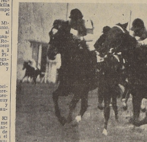
Topocilla precede por cabeza a Winnitza en la condicional de apertura

En la forma apuntada siguió la carrera hasta la tierra derecha, en donde Altona y Nacajuca liquidaron a los punteros, no demorando esta última en desprenderse de la hija de Siumum.