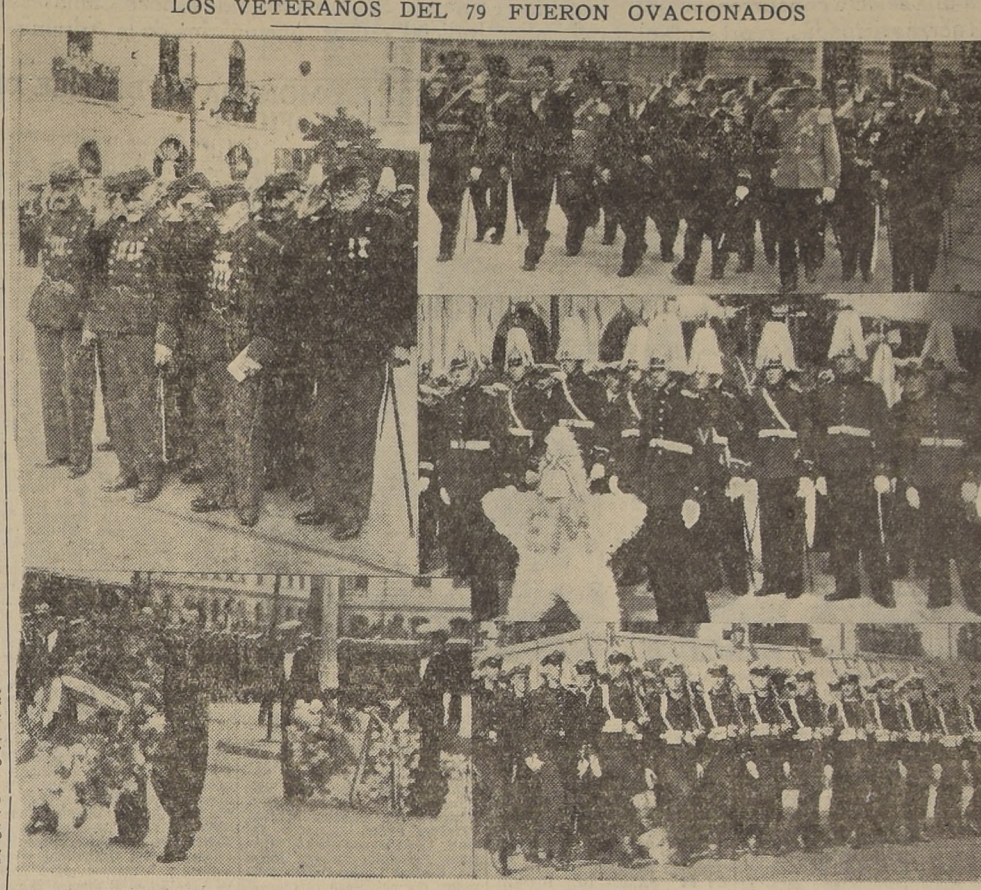
Los Veteranos del 79. — Las autoridades civiles, navales y militares de Valparaíso, se dirigen al monumento Prat. — La delegación de la Escuela Militar. — Las ofrendas florales. — La Escuela Naval desfilando.

En los diversos actos efectuados ayer participaron las Fuerzas Armadas, las autoridades e instituciones obreras. — Alrededor de 25,000 personas se dieron cita en la Plaza Sotomayor, para presenciar el acto patriótico que se desarrolló al pie del monumento a los héroes