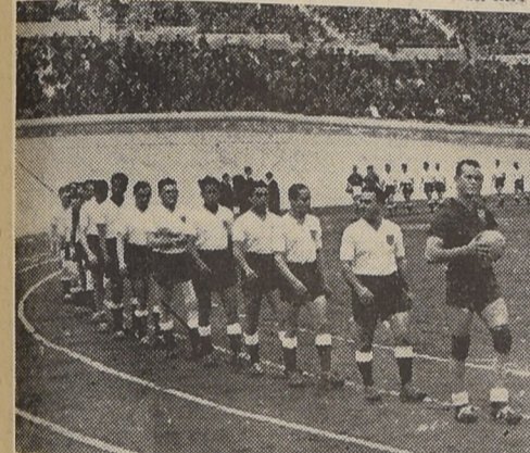
El desfile de los diferentes equipos de Colo Colo, club que ayer celebró en el Estadio Nacional su 16.º aniversario