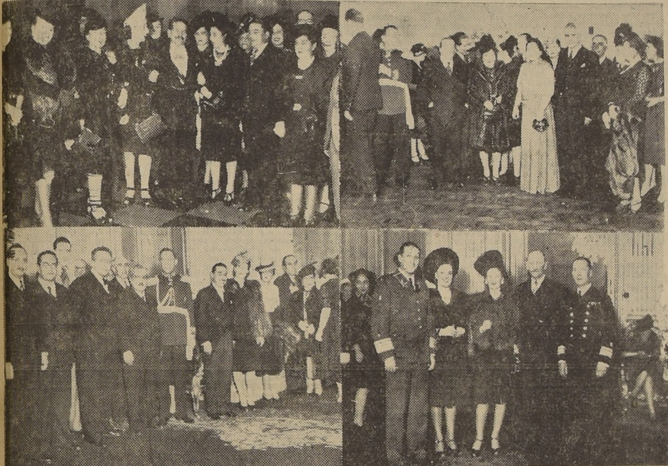
Diversos aspectos de la recepción ofrecida en la tarde de ayer, en La Moneda, por el Excmo. señor Pedro Aguirre Cerda y señora Juana Aguirre de Aguirre Cerda. En primer término, S. E. el Presidente de la República, con un grupo de damas asistentes a esta recepción. A continuación, la esposa de S. E., señora Juana Aguirre de Aguirre Cerda, acompañada de varias personalidades. Abajo, dos grupos de altos jefes de las Fuerzas Armadas, regidores y personalidades invitadas.