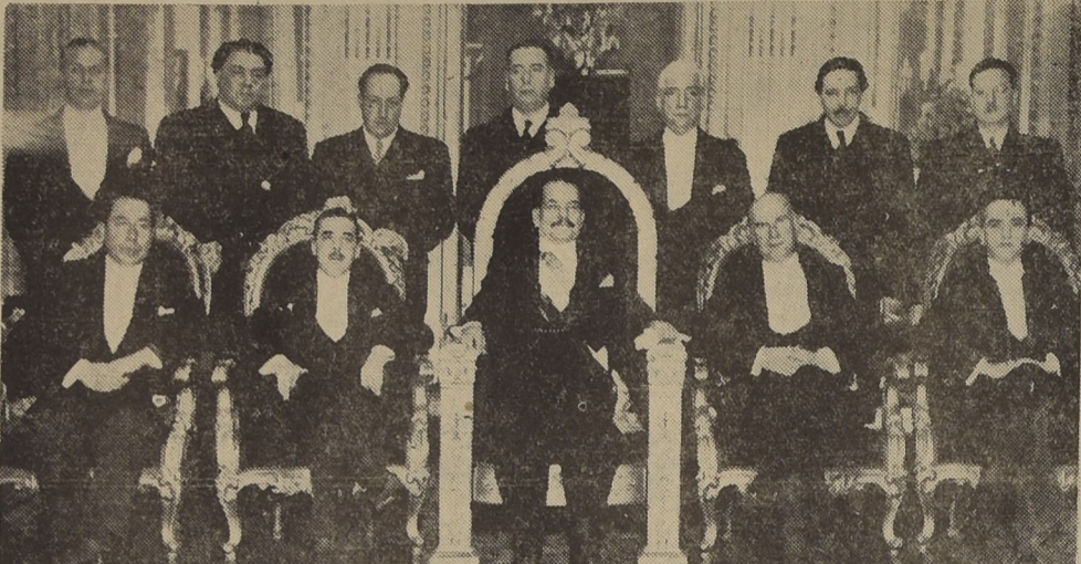
S. E. el Presidente de la República y su Ministerio, momento antes de dirigirse al Congreso Nacional a inaugurar el período ordinario de sesiones.

Con la solemnidad tradicional en esta clase de actos, ayer en la tarde se efectuó la inauguración del período de sesiones ordinarias del Congreso Nacional. Como de costumbre, la ceremonia oficial fué presidida por el Primer Mandatario de la Nación, Excmo. señor Aguirre Cerda, asistiendo a ella, además de sus Ministros de Estado, el Cuerpo Diplomático residente, miembros del Poder Judicial, altos funcionarios de la Administración Pública y representante de las Fuerzas Armadas.