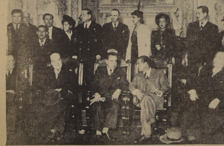
Durante el acto de ayer, en la Municipalidad, con motivo de la entrega de los premios del concuor su literario.