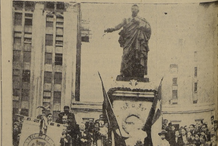
Miembros de la Defensa de la Raza, durante la ceremonia de ayer.

Después de rendir homenaje a S. E., realizó un lucido programa en Plaza de la Constitución. — Desfile de clubes de la institución