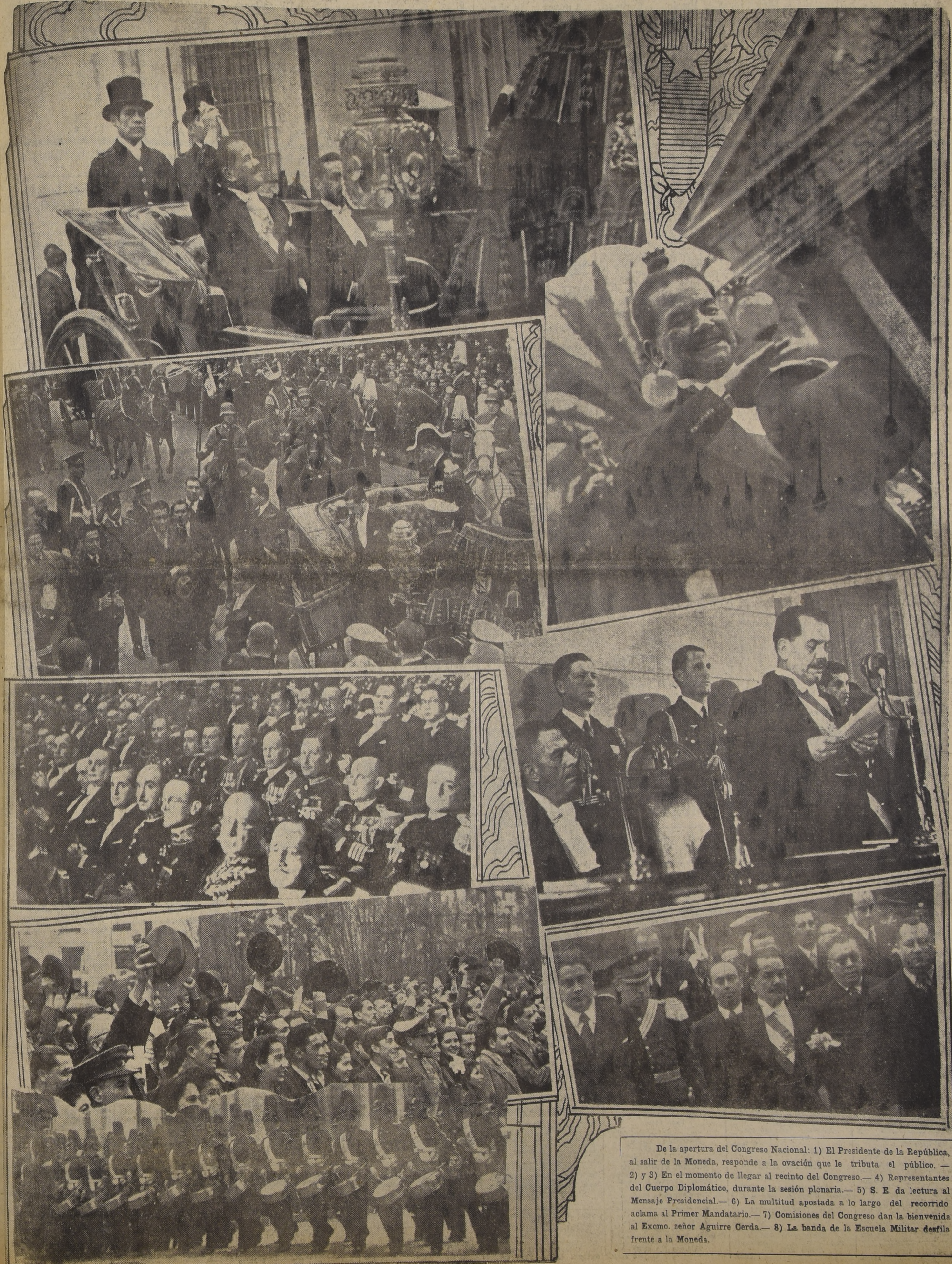
De la apertura del Congreso Nacional: 1) El Presidente de la República, al salir de la Moneda, responde a la ovación que le tributa el público. — 2) y 3) En el momento de llegar al recinto del Congreso. — 4) Representantes del Cuerpo Diplomático, durante la sesión plenaria. — 5) S. E. da lectura al Mensaje Presidencial. — 6) La multitud apostada a lo largo del recorrido aclama al Primer Mandatario. — 7) Comisiones del Congreso dan la bienvenida al Excmo. señor Aguirre Cerda. — 8) La banda de la Escuela Militar desfila frente a la Moneda.