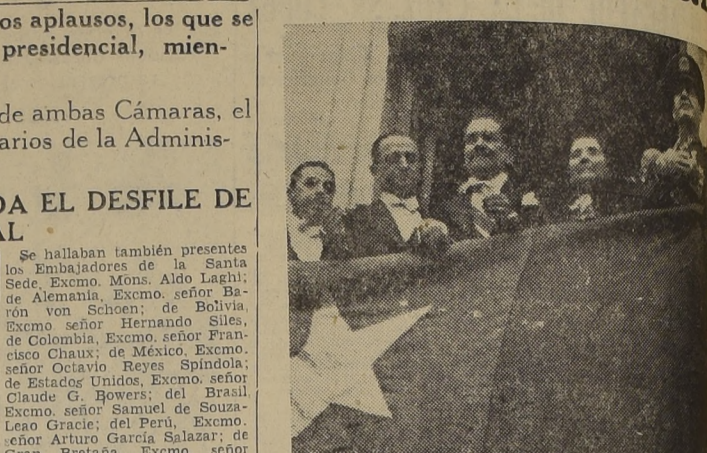
S. E. y señora Juana de Aguirre Cerda, presenciando el desfile desde un balcón de La Moneda.