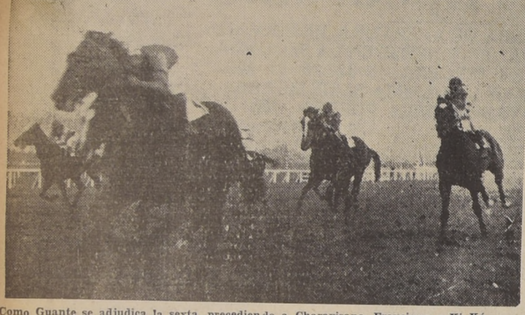
Como Guante se adjudica la sexta, precediendo a Charavisano, Fauignny y Ki Kú

Bandazo dominó la raya, pero debió ser exigido al hijo de Turbide, que logró batió por 12 pescezos, después de no pocos esfuerzos. Tercera, a 3/4 de cuerpo, finalizó Selvática, que precedió a Cardenal, María Stella y Divonne; últimos, Little y Padutina.