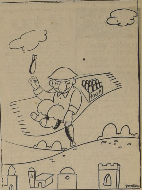
La alfombra mágica 1941 o el respeto a la tradición.

Un acuerdo suscrito en octubre de 1907 estableció los deberes y derechos legales de un neutral. Este acuerdo concierne a los derechos y deberes de una potencia neutral, como asimismo a las personas en caso de guerra. Por estos deberes y derechos son de orden exclusivamente militar, y ninguna cláusula contenida en él concede razón para sostener que la expresión de opiniones