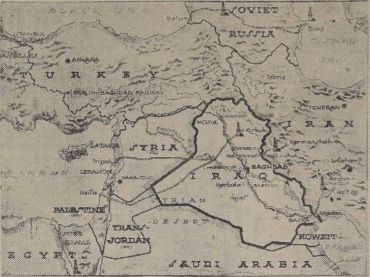
En el presente mapa puede advertirse la gran importancia estratégica de Siria. Su posesión por parte de los enemigos de Gran Bretaña cortaría el aprovisionamiento de petróleo del Irak y pondría en peligro al Canal de Suez.