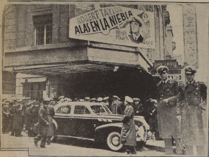
Jefes y oficiales de nuestra Fuerza Aérea, en la exhibición privada de "Alas en la Niebla", en el Teatro Metro.

"Alas en la Niebla", que estrena hoy el Teatro Metro, se exhibió ayer a unidades de nuestra Fuerza Aérea