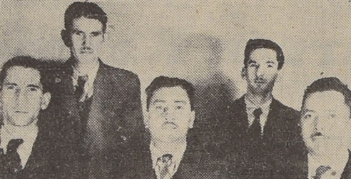
Miembros del nuevo directorio elegido por el Sindicato Industrial Obrero de la Mueblería París, progresista organización gremial