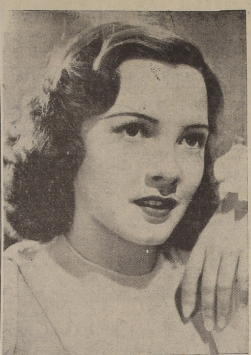
Kathryn Grayson, el nuevo "descubrimiento" de Hollywood; artista y cantante de dieciocho años, en su interpretación de secretaria de Andy Hardy, camina hacia el estrellato.

Una de las más entretenidas de las películas de la Familia Hardy es "La secretaria de Andy Hardy". Uno es cuando Andy se gradúa con los más altos honores en la Escuela Superior, y el otro cuando se despidió de esta vida el viejo automóvil de Andy, quien en lo sucesivo usará un flamante cupé que puede ser coche abierto y cerrado, a voluntad de su dueño.