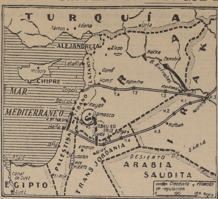
Las flechas indican la dirección de los principales avances de los ejércitos aliados

SI EL JEFE FRANCÉS SE NIEGA A HACERLO, LAS TROPAS ALIADAS, QUE SE HALLAN EN LAS INMEDIACIONES DE LA CIUDAD, INICIARAN ACTO SEGUIDO EL ATAQUE