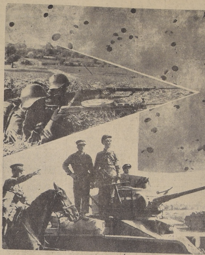
Soldados de caballería, tanques e infantería del ejército ruso. — Arriba, paracaidistas en pleno ejercicio.