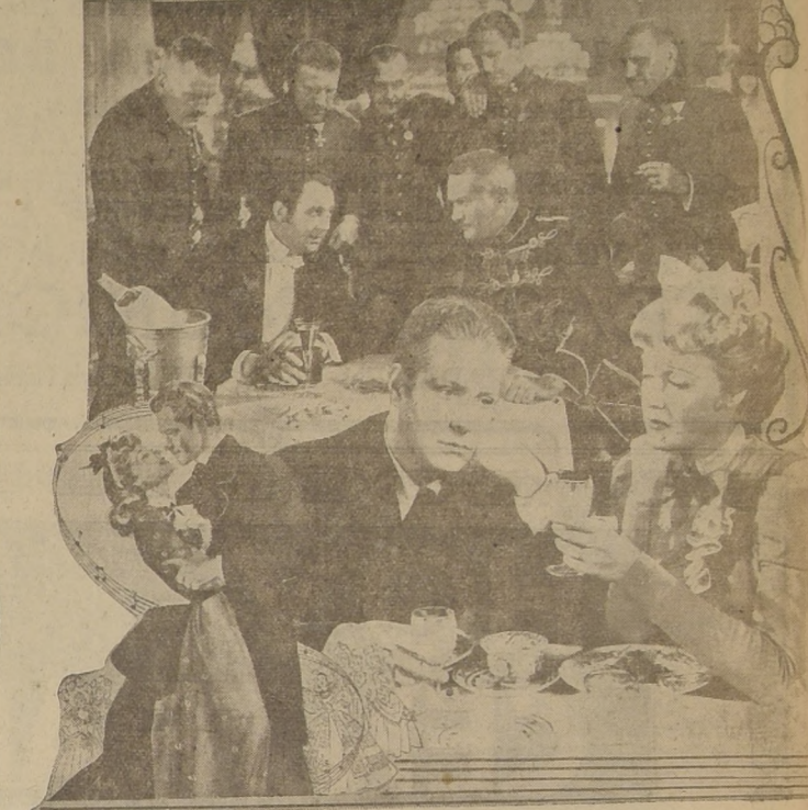
En estas escenas, de la película "Amarga Dulzura" que estrenará el próximo Viernes el Teatro Metro, palpita el alma musical de Hungría. Este sentimiento reflejado en sus czardas vibrará esta noche en el gran Salón de la Confeitaria "Lucerna", al iniciarse la primera rueda del GRAN CONCURSO DE VALSES Y DE CZARDAS que han organizado nuestro diario LA NACION y el TEATRO METRO.

Complemento: Dibujo de Popere, Sinopsis, Noticiero Argentino (estreno) y Noticiero Paramount, llegado ayer por avión.