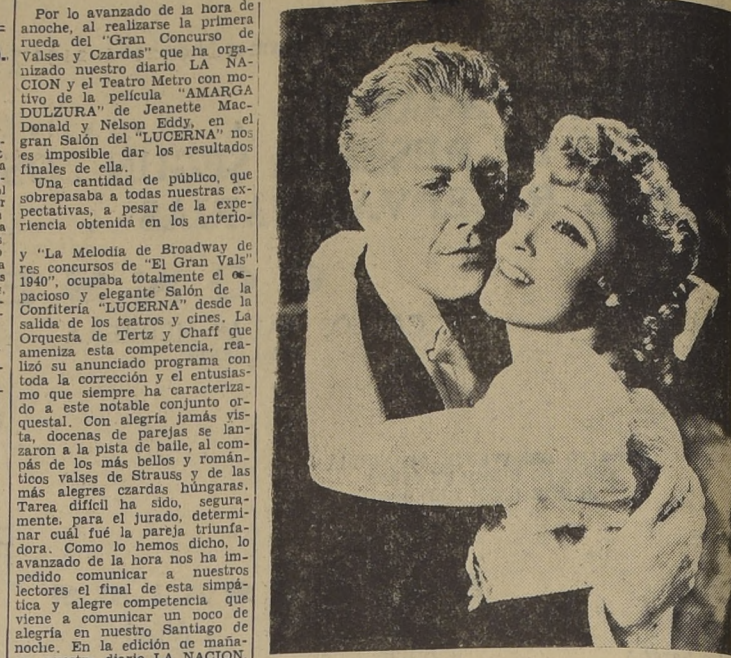
Jeanette MacDonald y Nelson Eddy, héroes de la hermosa película "Amarga Dulzura" que estrenará el Teatro Metro el próximo viernes inspiraron el Concurso de Valses y de Czardas que se desarrolla en el "LUCERNA" con éxito indescriptible

El gran Salón del "LUCERNA", repleto de un público ansioso por ver el desarrollo de esta original competencia, era una verdadera llama de alegría, entusiasmo y bullicio. — Esta noche se llevará a cabo la segunda rueda de este simpático torneo inspirado en la película "Amarga Dulzura" que estrenará el Teatro Metro el próximo viernes