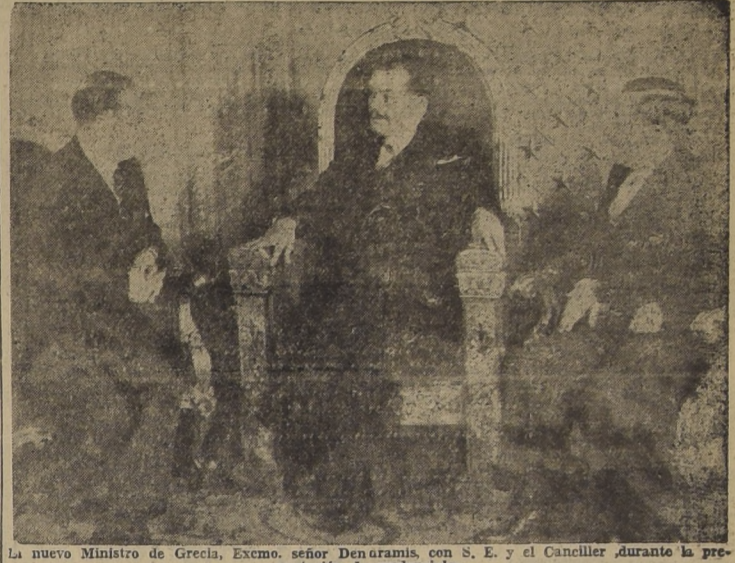
La nuevo Ministro de Grecia, Excmo. señor Dendramis, con S. E. y el Canciller durante la presentación de credenciales

El acto se efectuó en la mañana de ayer en el Salón de Honor del Palacio de Gobierno