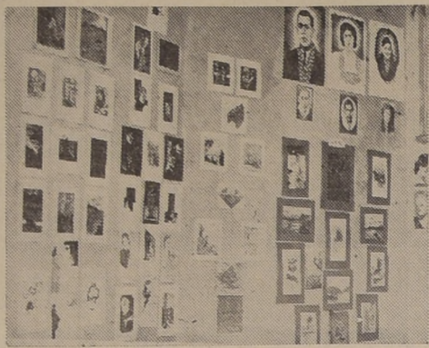
Un rincón del salón que esta noche se inaugura en el Club N.º 1 de la Defensa de la Raza de Valparaíso.

Los propósitos que reiteradamente se manifestó el Presidente de la República, Excmo. señor Aguirre Cerda, con respecto a la Defensa de la Raza y Aprovechamiento de las Horas Libres, han encontrado eco muy acogedor en este puerto, y así lo testimonia el Club N.º 1 de esa organización, que lleva el nombre de Centro Cívico, Cultural y Deportivo Valparaíso.