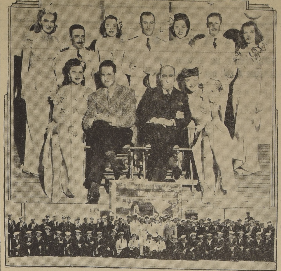
Oficiales y marineros del transporte chileno “Ranca gua”, en su visita a los Estudios Cinematográficos de la Warner Bros en Hollywood, donde fueron recibidos por la estrella Ann Sheridan...