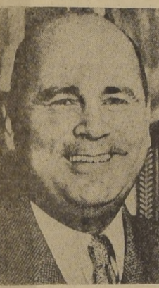
Excmo. señor Isaias Medina Angarita, Presidente de Venezuela.