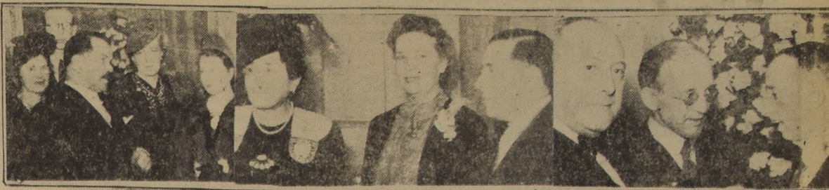
Diversos aspectos de la brillante recepción efectuada en la tarde de ayer, en la Embajada de los Estados Unidos de Norte América, con motivo de celebrarse el 165.º aniversario de la independencia de ese país. Asistieron S. E. el Presidente de la República y señora Juana Aguirre de Aguirre Cerdá; el Ministro de Relaciones Exteriores, señor Juan Bautista Rossetti; miembros del Cuerpo Diplomático y distinguidas personalidades de nuestro mundo social y político.