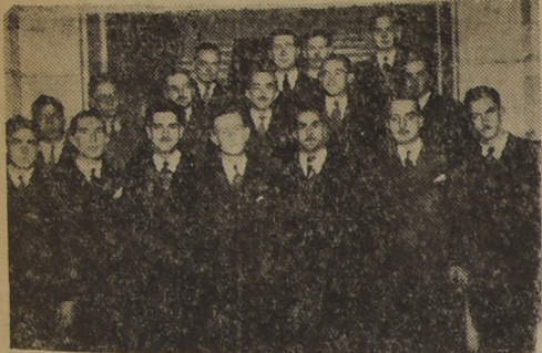
Asistentes a la comida que un grupo de amigos ofreció en el Club de Setiembre...