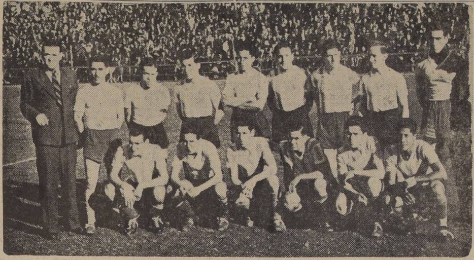
Cuadro del Magallanes que ayer cumplió una performance de muchos méritos, empatando a dos goles con Santiago Morning, un partido que debió ganar.