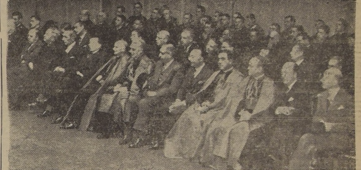
Personalidades que presidieron el acto de ayer en el teatro Municipal.

Personalidades que hicieron uso de la palabra