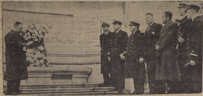
El Cónsul de Venezuela hace uso de la palabra, durante el homenaje de ayer

El Cónsul General colocó una hermosa corona en el monumento a Prat. — Personalidades asistentes a la ceremonia