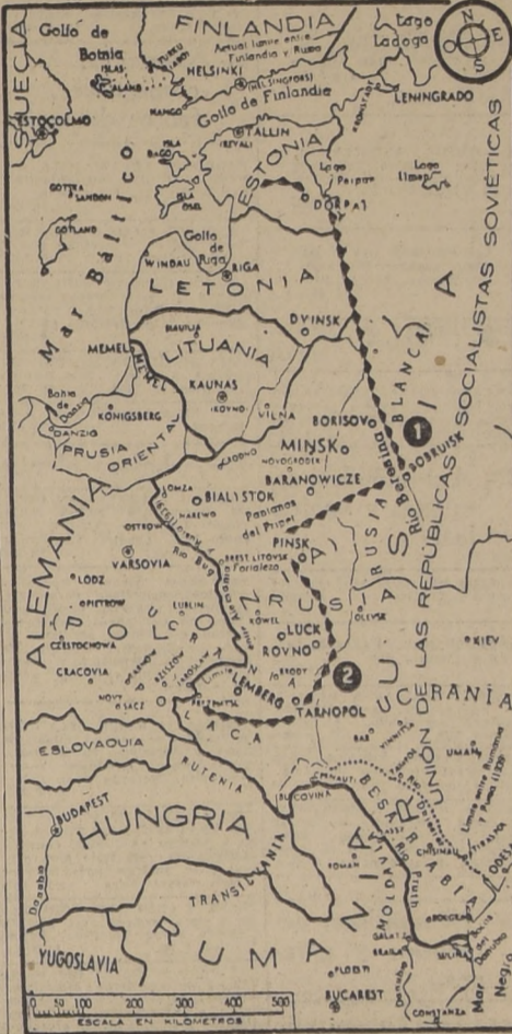
La línea dentada indica, aproximadamente, el límite del territorio ocupado por el ejército alemán. Los números 1 y 2 corresponden a los sectores en donde la lucha ha sido más encarnizada: el 1 corresponde al sector del río Prut, dejando detrás armas y municiones; el 2 a la saliente Rovno-Tarnopol.

SOLIDO FRENTE RUSO MOSCU, 8 (U. P.).—El ejército ruso continúa con su táctica de presentar un sólido frente contra todas las tentativas de los alemanes para perforar sus líneas defensivas, ofreciendo una resistencia firme y tenaz y contratacando cada vez que le es posible.