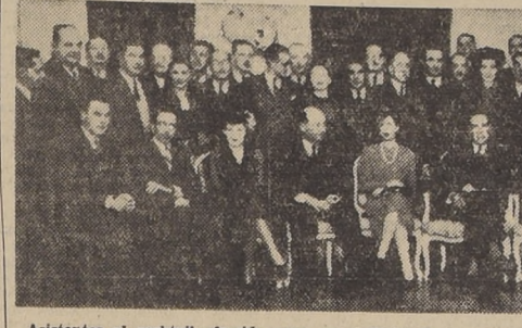
Asistentes al cocktail ofrecido ayer, en el Hotel Carrera, por el personal de la Comisión de Control de Cambios Internacionales, motivo del alejamiento del primero, y nombramiento del segundo, de la institución.