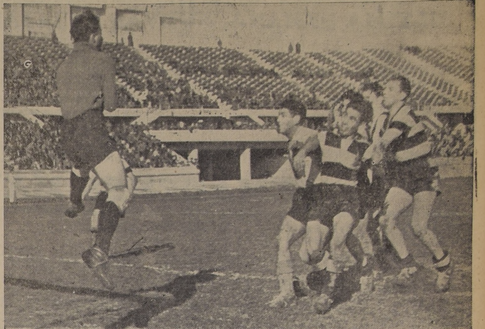
Ataniese salta y embolsa bien, ante una tentativa Saldívar. La actuación de los aurinegros fué, en realidad de verdad, la mejor sorpresa del día footballístico de ayer. (Del match Badminton - Santiago Morning).

amente a la indicada Zona, sea que ello signifique que pueda ampliarse el comienzo del torneo en otros puntos del país. Datos estadísticos. La Federación ha hecho imprimir un formulario especial a fin de que todas las Asociaciones afiliadas del país, en un plazo máximo de 30 días, procedan a enviar sus datos estadísticos en forma completa y uniforme.