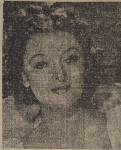
Myrna Loy, la seductora actriz, protagoniza junto con Melvyn Douglas, la graciosa comedia "Yo soy su Marido", que se estrenará en el Teatro Metro

Escribir la obra maestra de la literatura contemporánea es una noble ambición, después de todo... pero el inconveniente es escribirla... y que resulte ser verdaderamente una obra maestra. Por espacio casi de seis años, Lionel Houser ha estado produciendo magníficos argumentos cinematográficos, pero la novela de sus ambiciones, "Lago de Fuego", que según él le abriría las puertas de Hollywood... todavía no ha llegado a la pantalla y probablemente nunca llegará. A la edad de diecisiete años, siendo estudiante en el Instituto de Segunda Enseñanza de San Francisco, Houser se dedicó a crear el bigote y convenció a Cornelius Vanderbilt, Jr., de que él era un excelente crítico teatral. El joven Vanderbilt comenzaba por entonces a publicar el "San Francisco Daily Herald" y con su traje de batista solía dar una vuelta diaria por el periódico, motivo de que nunca descubriera que Houser, hasta aquella fecha, jamás se había preocupado de producir una sola página de un periódico. Quien en realidad se ocupaba de esas tareas, un anciano de ochenta años, estaba ya muy cansado para recorrer los teatros, y el joven Houser se encargó con gusto de hacerlo, haciendo películas teatrales y películas con igual imparcialidad.