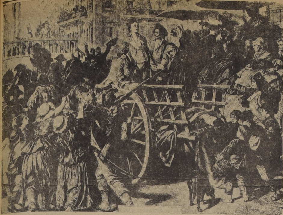
Dietrich, el patriota alsaciano, inspirador de "LA MARSELLA", encontró la muerte en la guillotina. Como un sarcasmo del Destino, camino del patíbulo, la turba sedienta de sangre entonaba los ritmos marciales de "La Marsellesa".