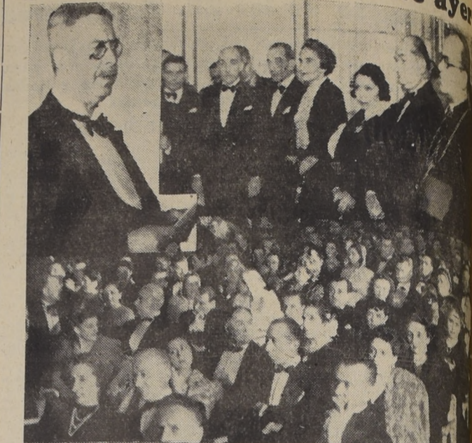
Don Miguel Cruchaga Tocornal leyendo su discurso durante la inauguración de la Radio Carrera. — Un grupo de personalidades asistentes. — Abajo, un aspecto general del público.

Un verdadero acontecimiento artístico y social significó la inauguración de la nueva Radio "Carrera", realizada anoche a las 22 horas. Esta ceremonia empezó a las 18 horas, momento en el que, por algunos instantes fueron abiertos los micrófonos transmitiéndose la bendición de la emisora, hecha por don Miguel Ángel Rivera, que fueron reproducidas ayer en los diarios del país.