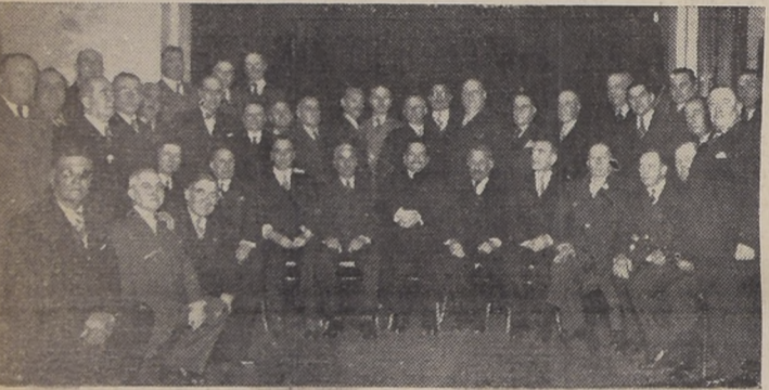
S. E. rodeado de los ex alumnos de la Escuela de Clases.

El Excmo. Sr. Aguirre Cerda fué profesor de ese establecimiento durante varios años