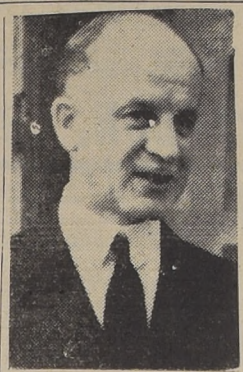
Mr. Sumner Welles

WASHINGTON, 21.— (U. P.) El Secretario de Estado subrogante, Mr. Sumner Welles, dijo en audiencia a la prensa que el Gobierno de los Estados Unidos dará todo su apoyo a Bolivia en caso de que la acción boliviana en contra del Ministro del Reich, Herr Goebbels, tuviese como consecuencia complicaciones internacionales.