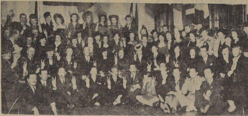
Cocktail ofrecido el sábado por el Comité Nacional de Francia Libre a sus colaboradores en la función del Teatro Municipal, del día 12, en homenaje a Francia Libre.