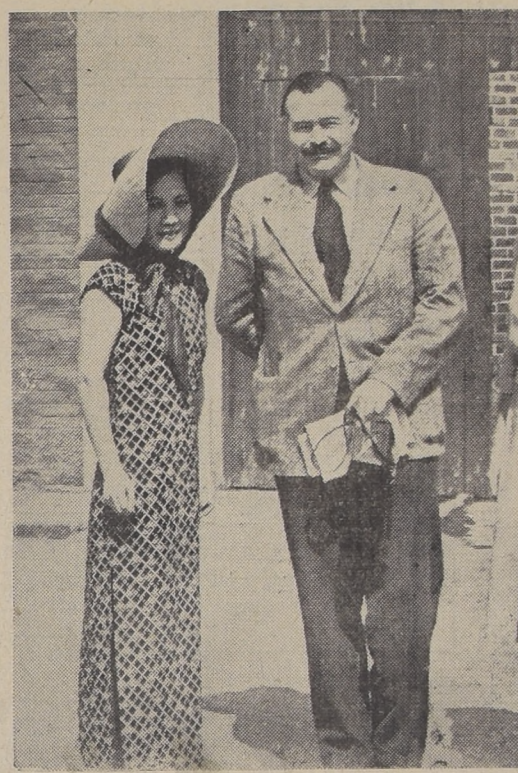
Ernest Hemingway y su esposa, juntos a la esposa de Chiang-Kai-Shek en la capital china

Después de haber estado varias veces en las maniobras británicas, el ambiente en el frente chino con los hombres que durante cinco años han luchado en los conflictos entre los Señores de la Guerra, 10 años con los Comunistas, y casi cuatro años con los japoneses, era tan diferente al del estado mayor británico como pudiera serlo el vestuario de un equipo profesional de fútbol con el del equipo de una escuela preparatoria.