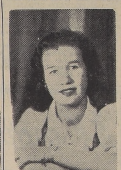
"Estrella del Río"