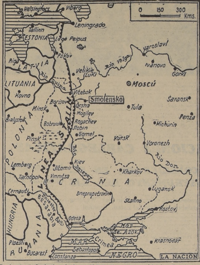
En el sector de Smolensk es donde se está luchando con mayor violencia. Los alemanes tratan de abrirse paso hacia Moscú, encontrando de parte de los rusos una tenaz y efectiva resistencia.

MOSCU, 21 (U. P.) — En el lacónico comunicado de guerra emitido esta mañana por la Oficina de Informaciones del Soviet, se anuncia que las hostilidades en gran escala en el frente occidental han entrado a su segunda semana con las fuerzas alemanas atacando fuertemente en dirección a Moscú y a Kiev con ritmo de blitzkrieg, habiendo atacado durante toda la noche en los sectores de Polotsk-Nevel, Smolensk y Novograd-Volynsk.