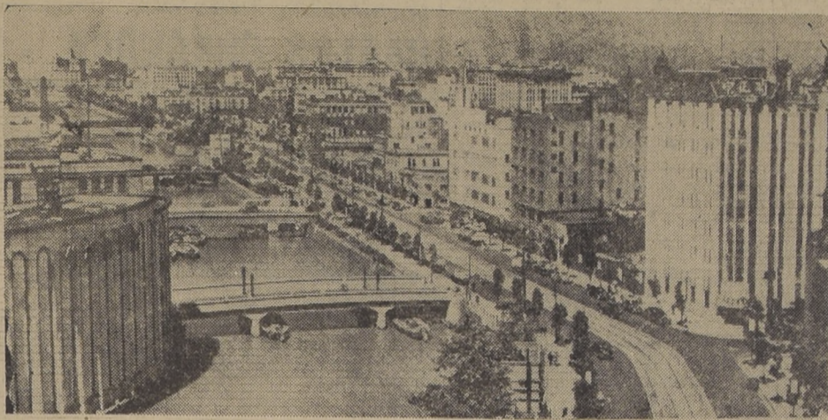
El barrio de Marunuchi, centro comercial de Tokio.

Se calcula que hay alrededor de 76.000 hogares inundados en 10 días de persistentes lluvias