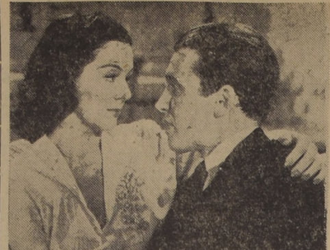
Rosalind Russell y James Stewart, dos actores de la pantalla norteamericana protagonizan la simpática cinta "El amor no es comedia", que exhibe desde ayer el lienzo del Reaj

No importa que James Stewart no se parezca a Errol Flynn o que Rosalind Russell no sea como Olivia de Havilland, pues cada actor tiene sus atractivos y las chuladuras de una dama de sociedad que tiene delirio de hacer del mundo materialista en que vivimos un paraiso de musas espirituales, forman el cuadro originalísimo de esta creación. La dirección estuvo a cargo de William Keighley, y las situaciones cómicas que la obra presenta no tienen rival.