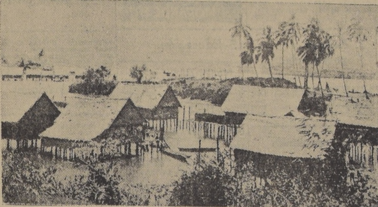
Una aldea de la costa septentrional de Borneo (Archipiélago Malayo)