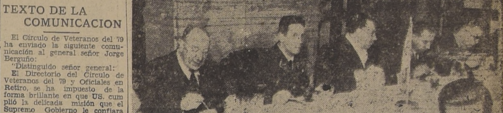
Durante el almuerzo en el Casino de la Escuela de El Bosque.

Concurrió el Ministro de Defensa Nacional don Carlos Valdovinos. — Visita a los hangares y almuerzo en el Casino del Bosque.