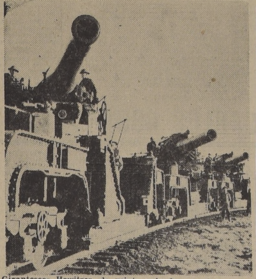
Gigantescos Howitzer, de veinte pulgadas, montados sobre rieles, listos para repeler cualquier tentativa de invasión de las Islas Británicas.