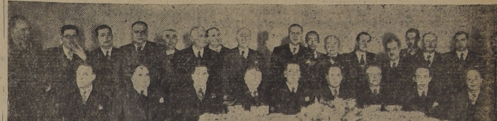
Le Caja de Crédito Agrario ofreció ayer, en su local de la calle...