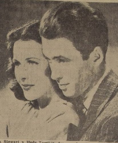
James Stewart y Hedy Lamarr, dos grandes figuras de la pantalla, unidas por primera vez en un mismo film

En las tres funciones de hoy matinee, vermouth y noche, estrenará el Teatro Metro la gran producción Metro-Goldwyn-Mayer "La Cuesta del Olvido".