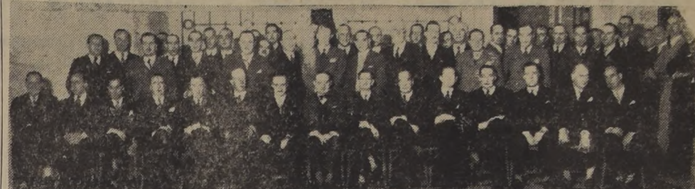
Asistentes al almuerzo ofrecido ayer en el Club de la Unión por los miembros del Comité de la Cruz Roja Chilena...