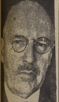
El señor Ernest Wetter, presidente de la Confederación Helvética...