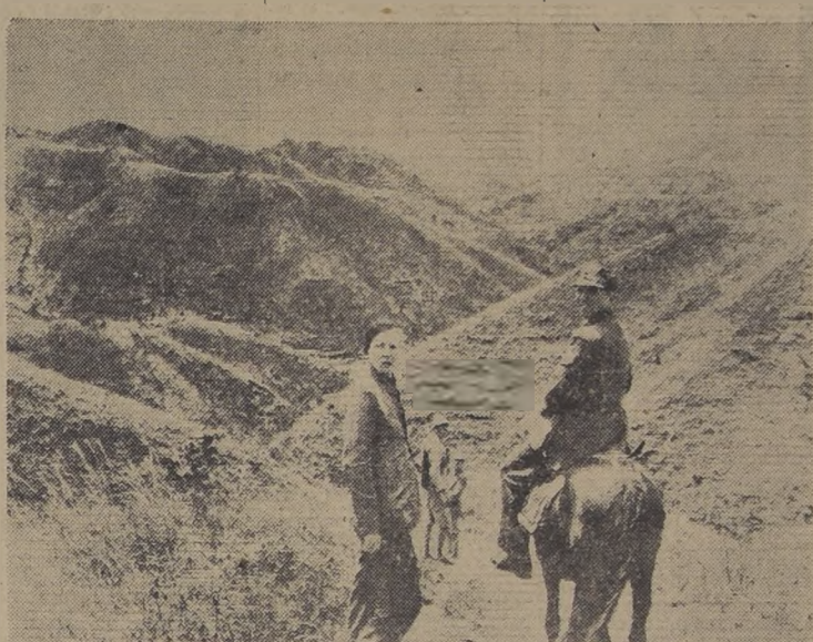
CAMINO A LA CHINA: La señora de Hemingway, escoltada por tropas de caballería china avanza por un sendero en las montañas de China hacia la lejana capital: Chung King. Puede apreciarse el aspecto montañoso del terreno en que actualmente se desarrolla la guerra en China

El texto del informe es el siguiente: "Es un placer, para mí, acompañar a los Ministros de Argentina y Brasil en esta memorable ocasión que constituye otra manifestación de la cooperación entre las Repúblicas americanas".