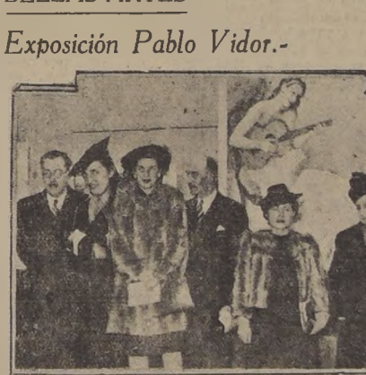
Asistentes a la inauguración de la Exposición de Pablo Vidor en la Sala del Banco de Chile.