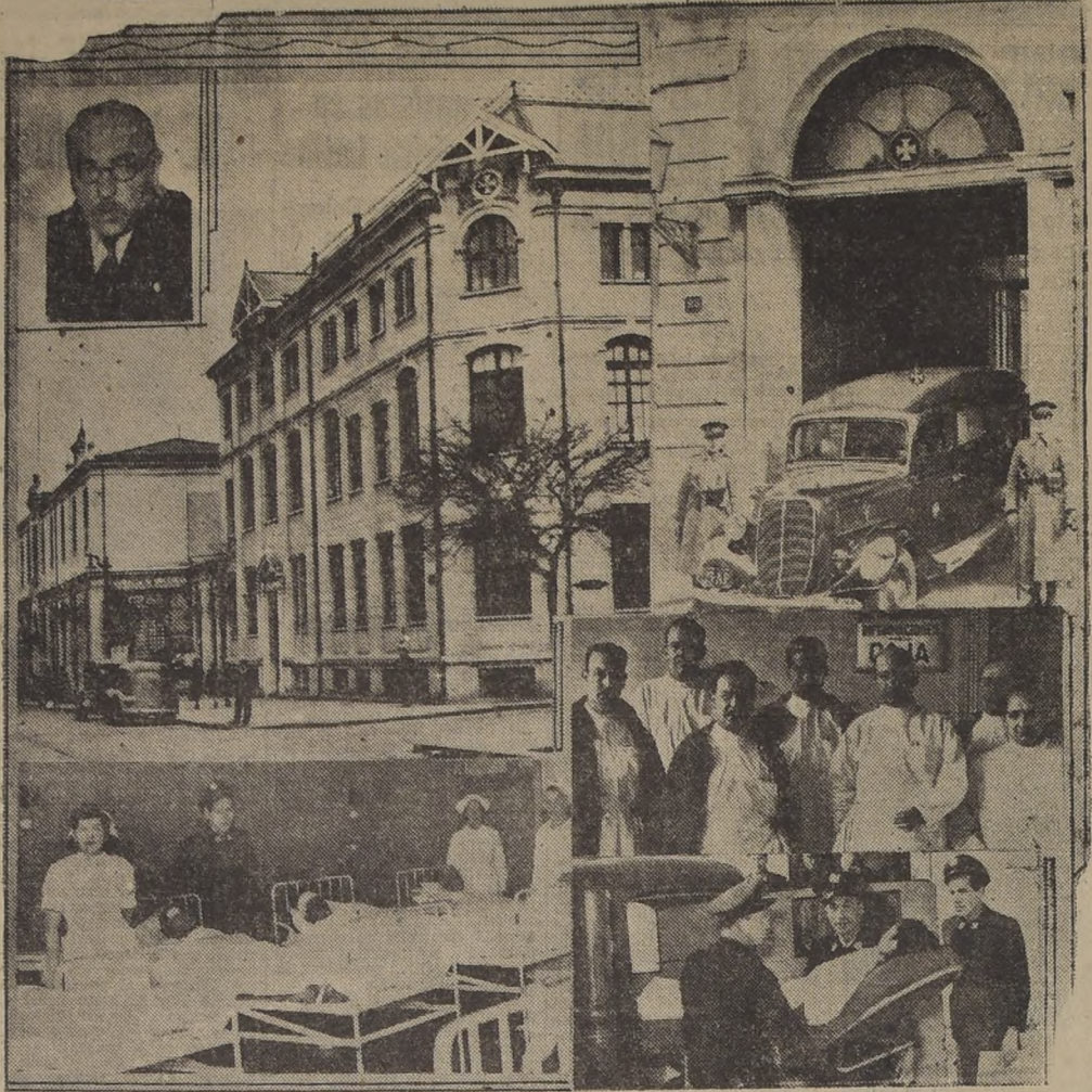
Diversos aspectos de los servicios de la Posta Central de la Asistencia Pública — Arriba, el médico jefe, señor Bahuaedo.

MAS DE UN MILLON Y MEDIO DE PERSONAS ATENDIDAS