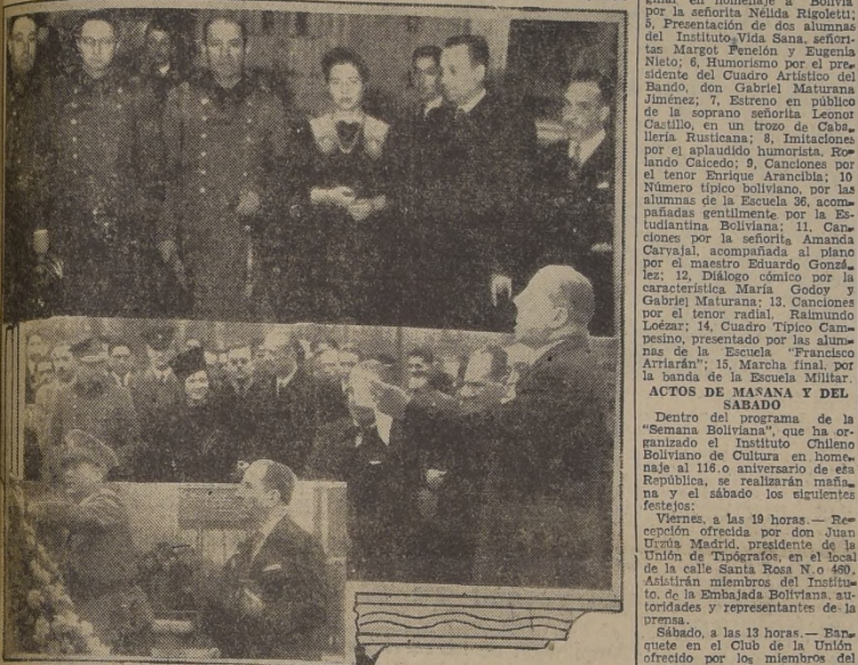
El Ministro de Defensa, y personalidades en la Embajada de Bolivia. — A continuación, durante el homenaje rendido en el monumento a Simón Bolívar. — Abajo, se coloca una corona en el monumento a O'Higgins