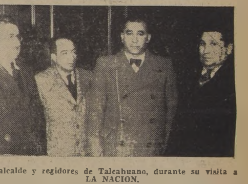
El alcalde y regidores de Talcahuano, durante su visita a LA NACION.

Han obtenido la solución de diversos problemas, como los de poblaciones obreras, nuevas calles, pavimentación y alcantarillado. — Las entrevistas celebradas HOY VISITAN A S. E.