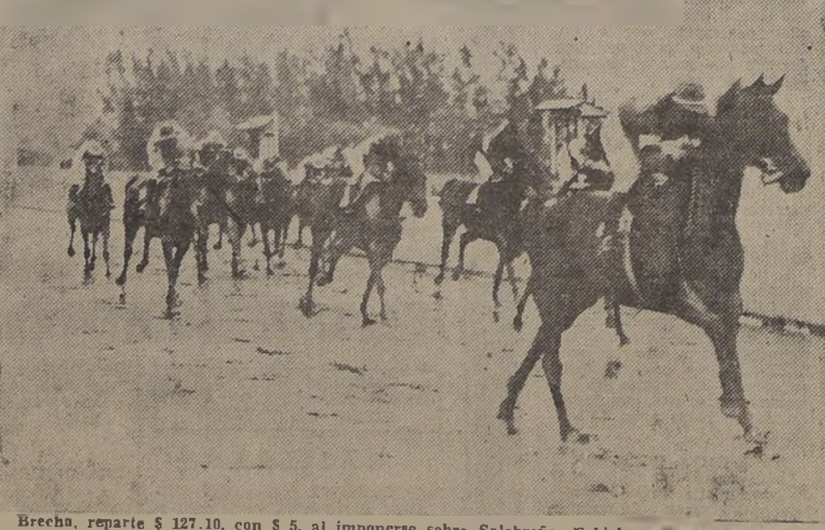
Brecha, reparte $ 127.10, con $ 5, al imponerse sobre Salobreña, Fabiola y Dania, en la con- dional de apertura.