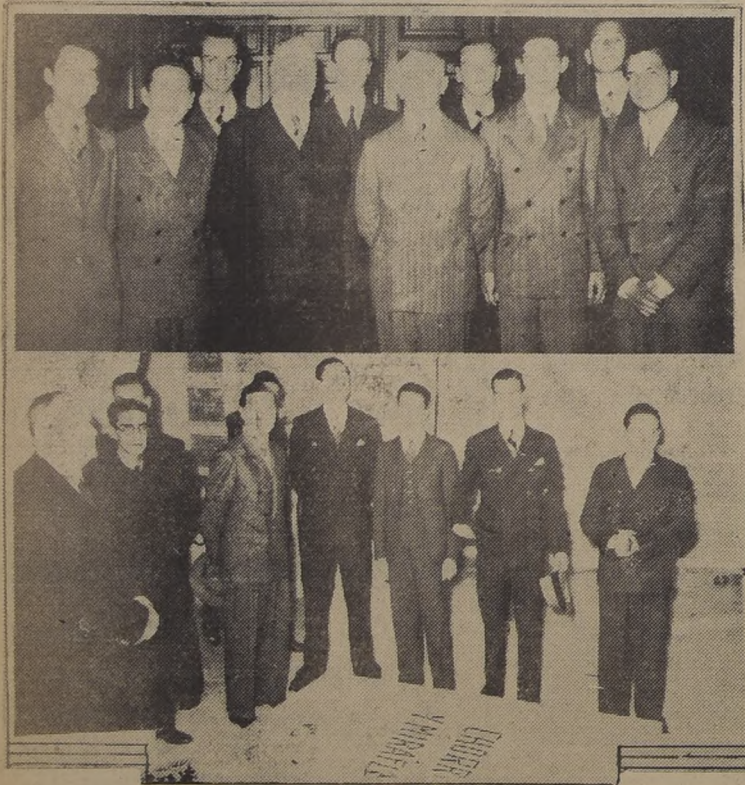
La delegación de estudiantes de la Escuela de Leyes de la Universidad de Chile, con S. E. el Presidente del Perú. Abajo, los estudiantes durante el homenaje rendido ante la Cripta de los Héroes.

Fueron recibidos por el Ministro de Educación.— Homenaje a los héroes del país hermano.— Visita a la tumba de don Bernardo O'Higgins