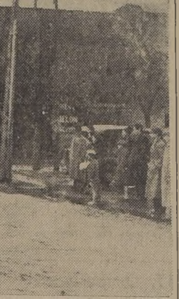
Zanjón de la Aguada