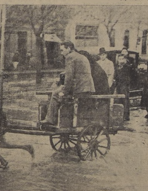
En las calles de la Comuna de San Miguel, funcionaron ayer servicios de emergencia, tan pintoresco como el que podemos apreciar en el presente grabado.

Un peñasco de 12 toneladas de peso se desprendió de una montaña y fué a caer en la línea del ferrocarril a la altura del kilómetro 82 entre las Chilcas y Llay-Llay, interrumpiendo por espacio de cinco horas el tráfico ferroviario entre Valparaíso y Santiago.