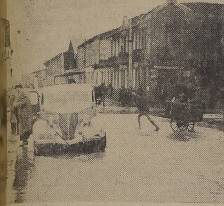
Otro aspecto de la inundación en las inmediaciones del Zanjón de la Aguada

EL PUEBLO DE NOGALES INUNDADO El desborde del estero Pucalal causó la inundación de la Población Pérez en la localidad de