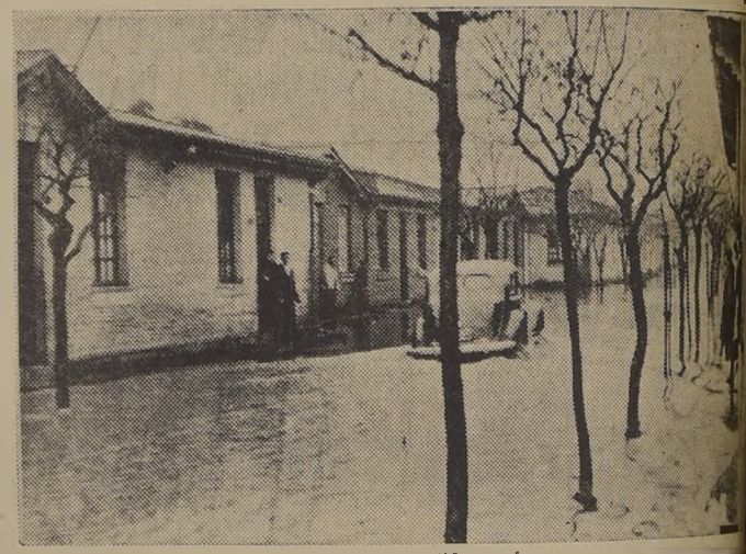
Otra calle convertida en río.

A las 21 horas en la Casa de la Sociedad Mac. de Pudahuel se sirvió una comida en honor de los directores de la Municipalidad de Pudahuel, quienes han sido especialmente invitados. Esta manifestación ofreció los directores de la Municipalidad de Pudahuel, quienes han sido especialmente invitados. Esta manifestación ofreció los directores de la Municipalidad de Pudahuel, quienes han sido especialmente invitados.