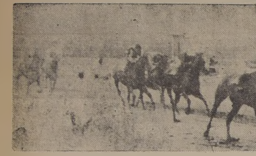
Pompon, que venia de rematar último en su anterior compromiso en la prueba ganada por Campolo, derrota a éste, Disparate y Quilaco en la mejor serie de los compromisos handicaps, abonando $ 80.60 con $ 5.

so la carrera hasta la altura del disco en donde avanzaron por la delantera Pompoon y Tientín Clipper a distancia por el lado interior. Tientín Clipper adelantó al derecho casi en una línea curva, viendo sus posiciones ama- gadas al nuevo leader por dis- tante al que cruzó en los o- mientes del derecho oblitando a Marchant al levantarlo. Demostrando ahora muy defien- das condiciones a las puestas de manifiesto en su anterior com- promiso, pues de largo a la la- zada y muy cerca de la raya di- stanció a Dania y Regional, que seguían a retaguardia. Tercero a un cuerpo y medio, Disparate delante de Quién Será, Quinto, Michigán, y Tientín Clipper que se agotó al final. GOOD LUCK EN LA PENULTIMA Al galope se impuso Good Luck en la penúltima, tercera