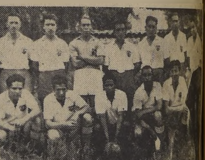
Elenco de honor del Club Eugenio Matte, actual campeón de Football, que con verdadero orgullo ganó la Maletaria "El Viajante". Va en empate con el club Vivero.

La colocación de los equipos que participan en el campeonato especial de football que organiza la Maletaria "El Viajante", es la siguiente: en primer término se encuentran los clubes Vivero y Eugenio Matte, con un punto en contra; luego vienen con tres puntos en contra, el Italo Chileno y Deportivo Pedro Aguirre Cerdá; en séptima, el Deportivo Vasca. Los demás instituciones marchan en forma compacta, especialmente Matte y Estadio Millán.