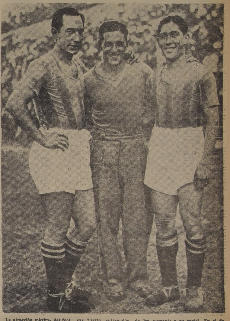
La atracción máxima del football argentino, por el momento Isidro Langara, a quien vemos en esta foto acompañado de Os...