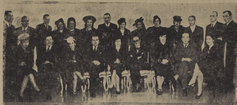
Asistentes a la comida ofrecida en el Hotel Carrera...