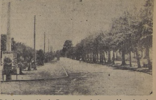
Principal avenida de Rengó, otro de los pueblos afectados

DE RENGÓ El Gobernador de Rengó, señor Solís Gonsolo, envió el siguiente telegrama: "Con el temporal de anoche se produjo el anegamiento de la ciudad en sus principales calles y sector de la isla. El camino longitudinal está cortado totalmente. El tráfico está interrumpido en Canal Tipauné, norte Rengó, Portezuelo y Pelequén Sur. El Cuerpo de Bomberos, carabineros y cuadrillas de obreros establecieron salvataje en numerosas casas, inundadas de las calles Rodríguez y Condell. Se ha..."