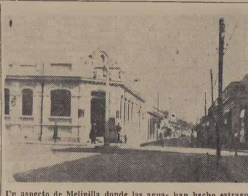
Un aspecto de Melipilla donde las aguas han hecho estragos