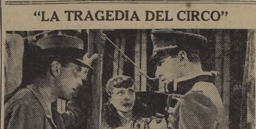
Una escena de la interesante película Warner Bros. "La tragedia del circo"...