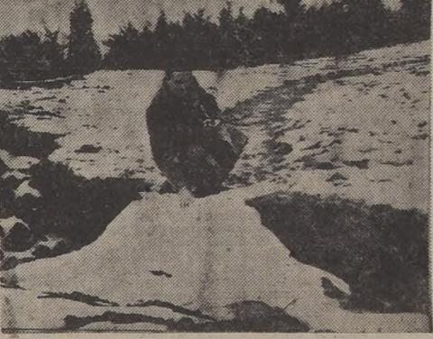
La nieve en el Alto del Puente, alcanzó más de treinta centímetros de espesor.

Este espectáculo fué presenciado en el Alto del Puerto, Camino a Casablanca, Placilla y otros sectores