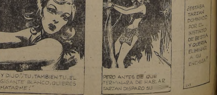
Y DIJO: "TU, TAMBIEN TU, EL GIGANTE BLANCO, QUIERES MATARME!" PERO ANTES DE QUE TERMINARA DE HABLAR TARZAN DISPARO SU FLECHA.