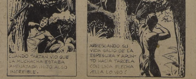
CUANDO TARZAN VIO QUE LA MUCHACHA ESTABA AMENAZADA, HIZO ALGO INCREIBLE. ARRIESGANDO SU VIDA SALIO DE LA ESPESURA Y APUNTO HACIA TARCELA CON UNA FLECHA YELLA LO VO!