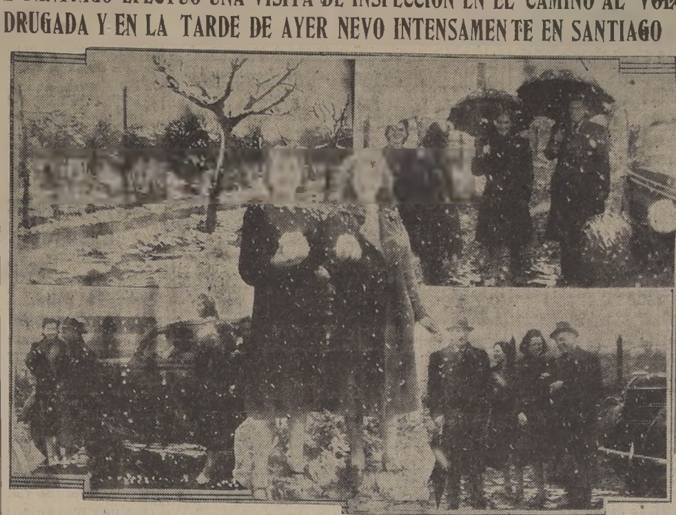
Unos aspectos de la intensa nevazón que cayó ayer en el barrio alto de la ciudad. La nieve cubrió jardines, calles y caminos. Los automóviles pasaban con gruesas capas de nieve en los parabrisas y pisaeras y los paraguayos quedaban emblanquecidos. Numerosas familias aprovecharon esta oportunidad para trasladarse a ese sector, a fin de disfrutar del espectáculo que desde hacía años no presenciábamos en la capital.

de lluvia que azotó a las provincias de O'Higgins y Maipo ayer en forma de granizo. Sin embargo, en la zona de Maipo, se dejó sentir durante el día, un intenso viento que azotó a las provincias de O'Higgins y Maipo. además, en las provincias de O'Higgins y Maipo, se dejó sentir durante el día, un intenso viento que azotó a las provincias de O'Higgins y Maipo. además, en las provincias de O'Higgins y Maipo, se dejó sentir durante el día, un intenso viento que azotó a las provincias de O'Higgins y Maipo.