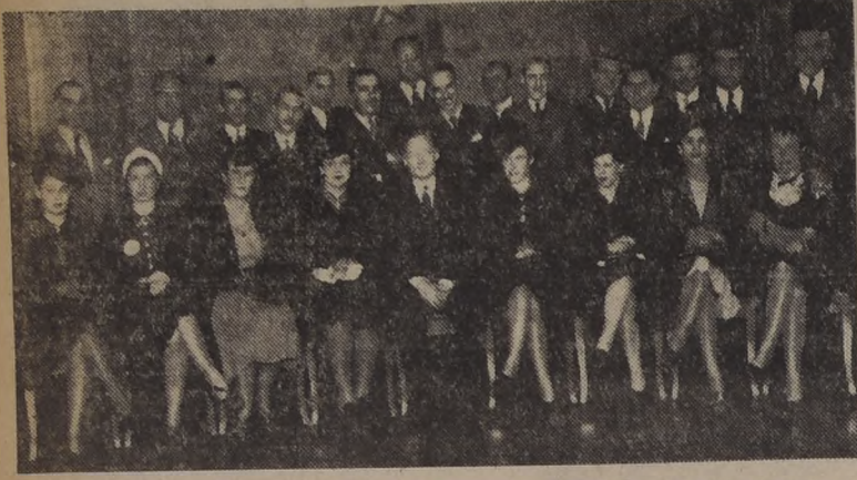
Amistades y parte del personal de la Metro G. M., en Santiago, exteriorizan su afecto al gerente de dicha empresa, con un magnífico cocktail que se sirvió en los salones de Recepciones de la Confitería Lucerna.