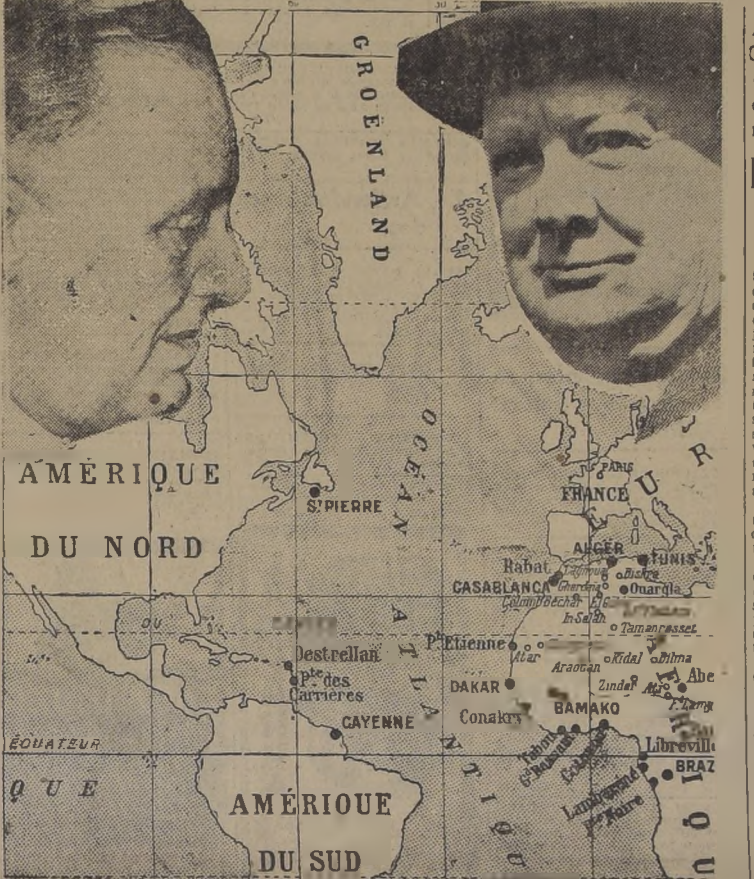
La reunión de mayor trascendencia entre estadistas de las potencias democráticas, fué celebrada entre Roosevelt y Churchill, a bordo del "Prince of Wales". Con la declaración conjunta firmada por ambos, se ha hecho más estrecha la unión anglo-norteamericana en la lucha contra el Eje.

Alemanos anuncian que Odessa y Nikolaiev se encuentran rodeadas y que ocuparon la región minera de Krywoi Rog