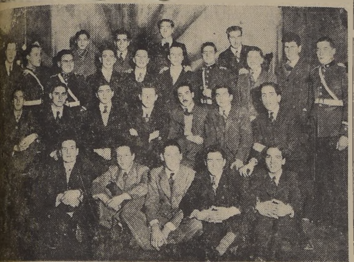
Recepción ofrecida en los salones del Tong-Fang, por los alumnos egresados del 6.º año del Instituto Nacional del curso de 1939.

ANTHONY'S CHURCH. 18th Sunday after Trinity. Holy Communion.