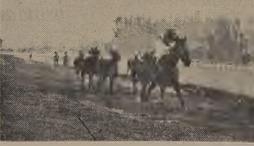
Nuestro favorito Llay-Llay se adjudica la segunda, derrotando a Río de Oro, Fenelón y Heurlizer

Este orden se mantuvo sin alteración hasta la curva, en donde Magerit se aproximó a Ferride, y Tientsin Clipper comenzó a mejorar de colocación por el lado exterior, aprestándose para la lucha final.