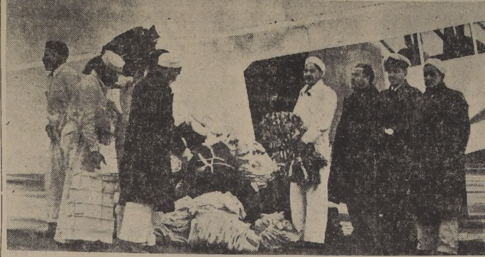
Personal de la LAN, carga una de las máquinas con víveres y vestuario destinados a La Serena y Ovalle.

Aconcagua. Se ha solicitado la ayuda de Carabineros y del Regimiento de Zapadores para hacer las reparaciones necesarias. — EL CORRESPONSAL.