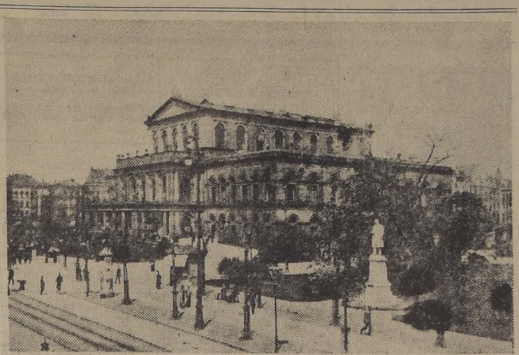
Un aspecto de Hanover, ciudad que constituyo el principal objetivo de la Real Fuerza Aérea durante el día de ayer.

Fuercn ocupadas las minas de Krywoi Rog. Sigue la persecución de los rusos en Ucrania. Odessa, un nuevo Dunkerque