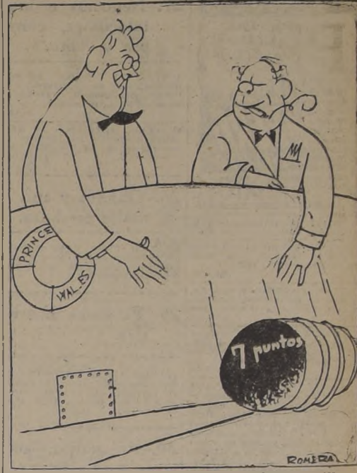
La bomba de profundidad, Roosevelt-Churchill.