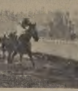
Le Magicien que, venía de rematar última el pasado domingo, en la carrera ganada por Pompoon, derrota al galope a Bergerac, Malilme y Bacarat, en la mejor serie de los handicaps de velocidad

los palos, estando breves instantes a la vanguardia, pero pronto quedaron en una línea con él, Le Magicien, Rotschild y Bergerac, entablándose la lucha por el puesto de honor.