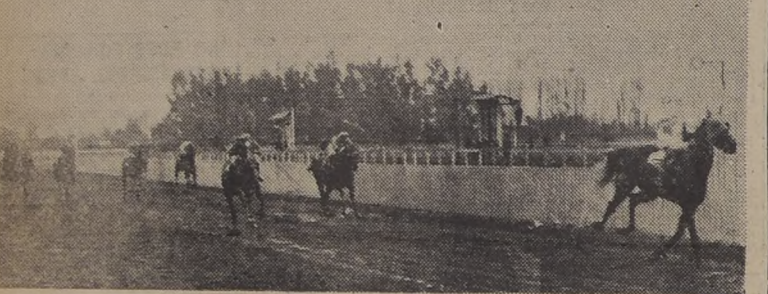
Tientsin Clipper que, venía de rematar última el pasado domingo, en la carrera ganada por Pompoon, derrota al galope a Magerit, Malilme y Bacarat, en la mejor serie de los handicaps de velocidad