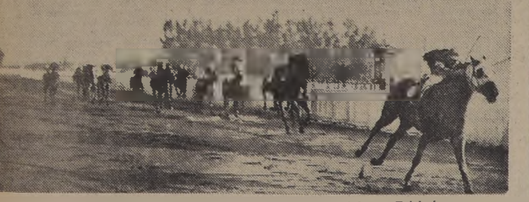
Rimpianto sale de perdedores, sobre Stentarello, Arica y Tulahuén

Poco antes de llegar a la curva final, Amuleto dejó atrás a Blanca Nieve, quedando en el tercer lugar, y tercero Le Magicien, colocándose cuarto Bergerac con poca ventaja sobre Julepe, orden en que desembocaron al derecho. Aquil, Amuleto se deslizó por