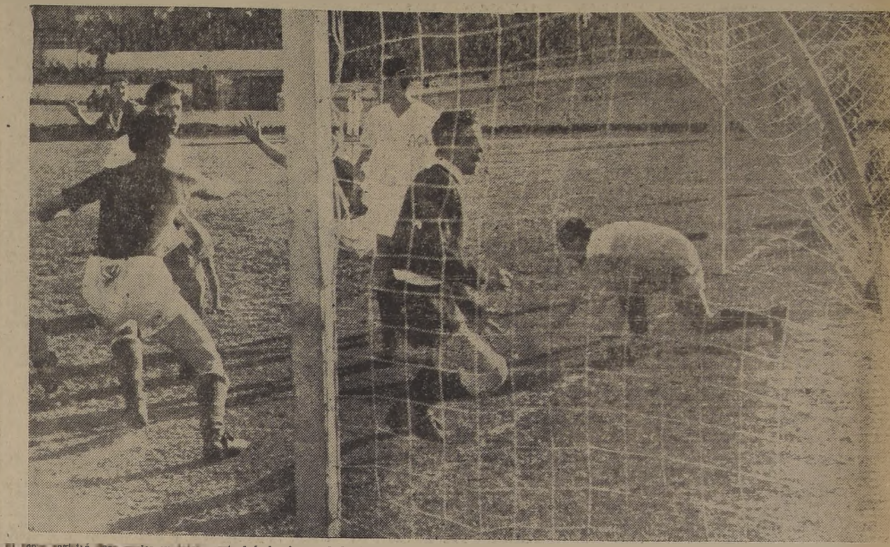
El tiro cruzado marcó el primer tanto de los verdes, colocaron los porteros Diano salió de su portico; pero con poca fortuna, situación que aprovechó Herrera, centro delantero visitante, para enviar la pelota a las redes vallendese de un cabezazo. En esos momentos la cuenta era de un punto por 1-0.