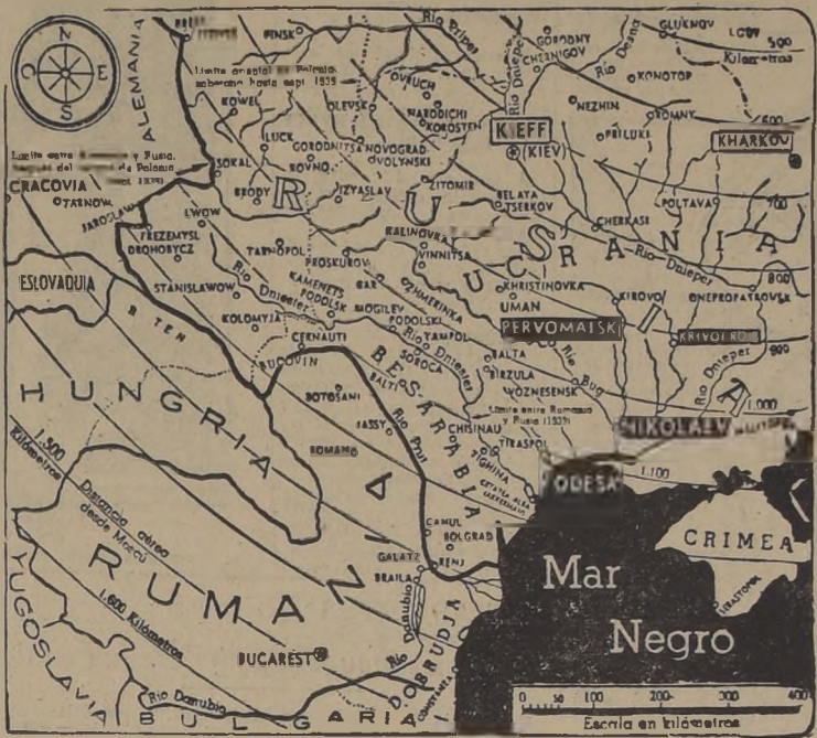
La toma del importante puerto y base naval de Nikolaiev, significa que Cherson y las zonas circundantes que bordean el Mar Negro, se encuentran ahora directamente amenazadas por los invasores.