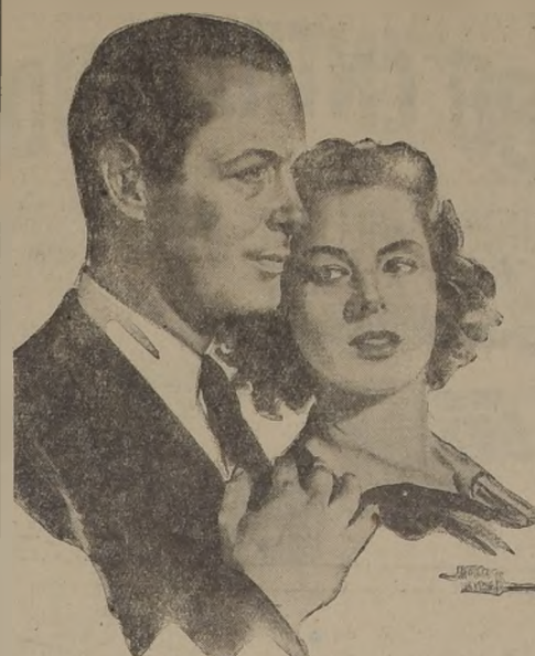
Robert Montgomery y la gran estrella sueca Ingrid Bergman...