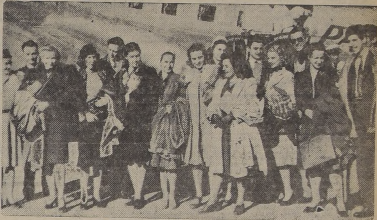
Un grupo del American Ballet que se estrena hoy

Esta tarde quedará satisfecha la expectación producida en el público, por conocer el "American Ballet", espectáculo coreográfico de alta calidad artística y que, procedente de Nueva York, viene realizando una gira, por los diversos países de América.