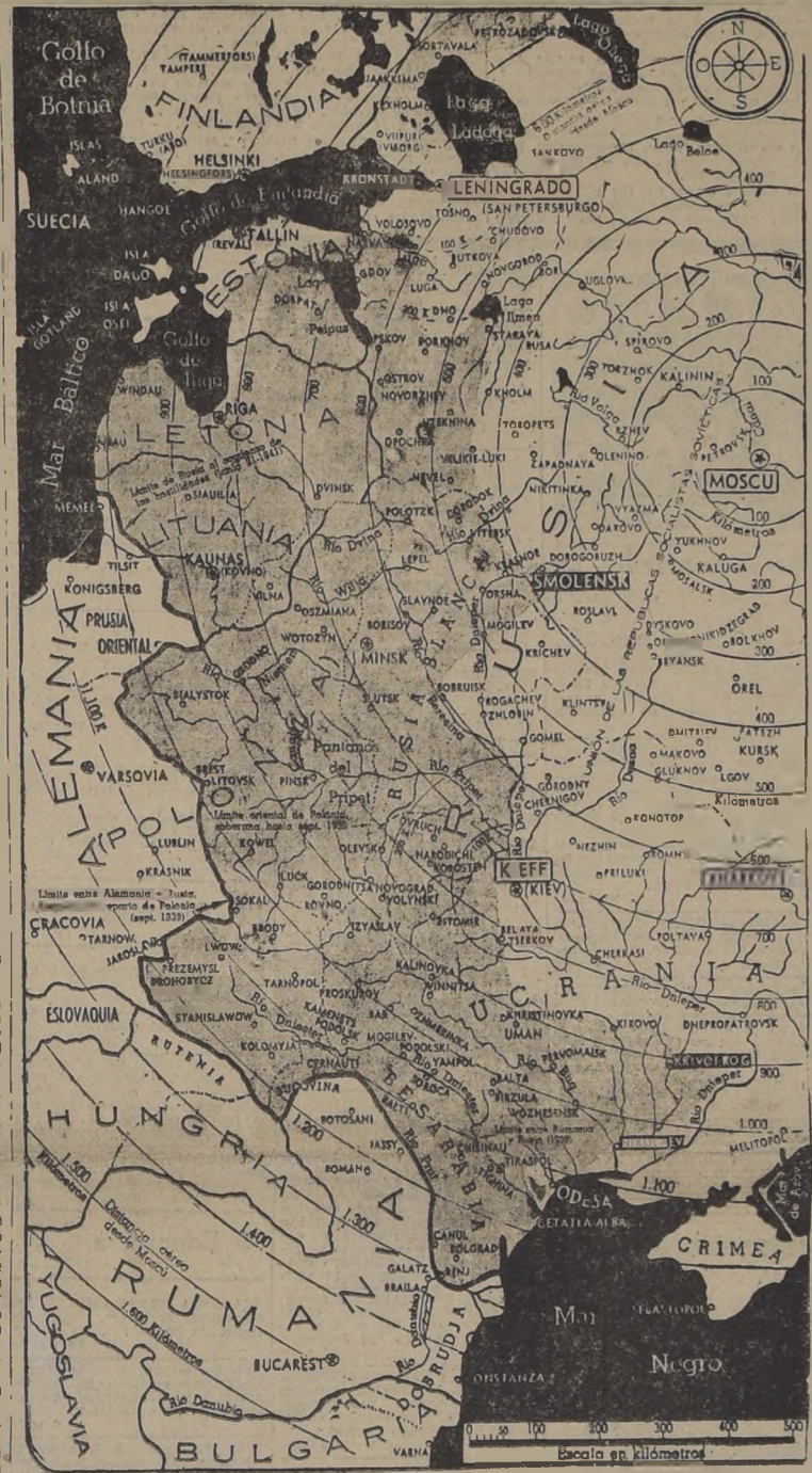
La lucha en el frente oriental continúa con mayor violencia en todos sus sectores. El sector grisado corresponde a los territorios ocupados por las fuerzas alemanas después de encarnizadas batallas.

En Ucrania el mayor peso de la ofensiva alemana se ha concentrado en el río Dnieper