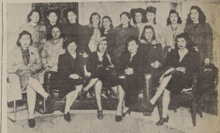
Un simpático grupo de damas, en el Lucerna.