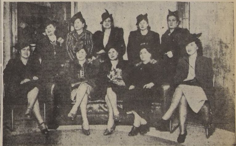
Un grupo distinguido en la famosa Confitería.