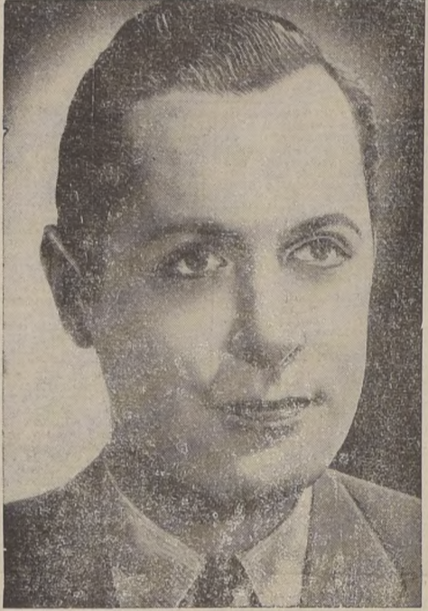
Robert Montgomery, famoso por sus creaciones interpretativas, y que con la nueva estrella sueca, Ingrid Bergman, protagoniza "Alma en la sombra"

En las funciones de mañana, vermouth y noche, estrenará el Teatro Metro hoy, una de las obras cinematográficas de mayor emoción. Nos referimos a "Alma en la Sombra", adaptación de una novela de James Hilton, el autor de "Horizontes Perdidos" y "Adiós a Mr. Chips". Robert Montgomery, tiene en esta nueva película que encarnará a un personaje dominado por la pasión de los celos. Montó un programa, correctísimo, severo, sin gestos exagerados ni miradas de espanto logrando comunicarnos el desequilibrio mental de su personaje mucho antes de que los conocidos sabidos le expliquen las situaciones de escena lo descubran. Por los celos llega hasta el crimen, al crimen perfecto que encierra la venganza perfecta. Ingrid Bergman, la estrella sueca, individualmente interpreta de "Inferno" y "Tu nombre es Mujer", tiene a su cargo el rol de la que tiene que vivir junto a un ser cuya mente se va extraviando poco a poco hasta sentir el efecto de matarla, por el mismo grande amor que le profesa. George Sander, el actor de carácter, tiene a su cargo el otro ángulo del triángulo extraño de esta notable novela de Hilton. Sander, como el amigo leal que sabe guardar el secreto de un gran amor, nos da un personaje todo sinceridad, fuerza y vida, intensamente verídico. "Alma en la Sombra" se estrena.