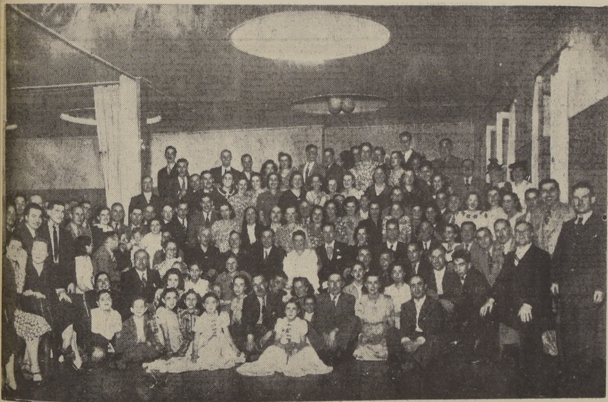
Matrimonio celebrado íntimamente en el salón de recepciones de la Confitería que ofrece las más amplias comodidades. A este matrimonio asistieron, también las relaciones de la novia como las del novio, las que dieron brillo y animación a la magnífica fiesta.