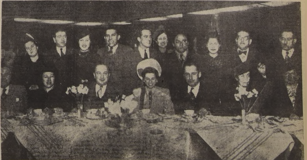
La juventud en un momento en el Lucerna.