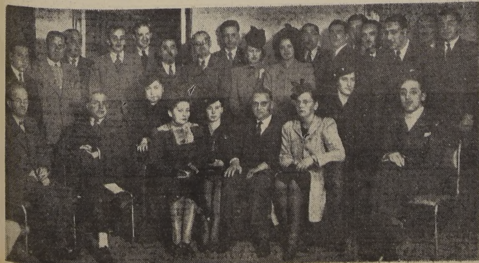
Una agradable reunión en la Confitería Lucerna.