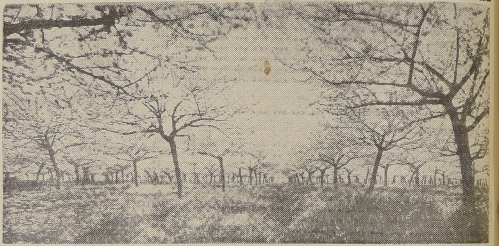
Insospechados recursos se obtienen con los subproductos del huerto frutal.

Además de las explotaciones ya de sobra conocidas, como las frutas desecadas, en conservas, etc., nos referimos en estas líneas al aprovechamiento de lo que tal vez podríamos llamar los subproductos del huerto frutal.