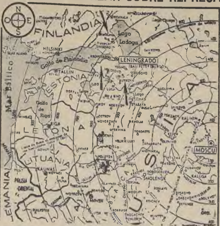
El principal teatro de la lucha germano-rusa se ha trasladado al norte, donde la ofensiva contra Leningrad ha entrado a su fase decisiva...