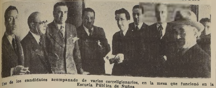
Uno de los candidatos acompañado de varios correligionarios, en la mesa que funcionó en la Escuela Pública de Ñuñoa

En las elecciones extraordinarias en Santiago, a que se había convocado en diversas mesas de las comunas que no funcionaron en la elección general, se efectuaron el número de votos y hubo completa tranquilidad.