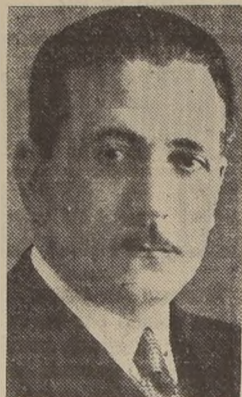
Excmo. señor Alfredo Baldomir, Presidente de la República del Uruguay