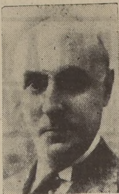
Excmo. señor Carlos de Santiago, Ministro del Uruguay en Chile

La República del Uruguay cuya independencia fue declarada el 25 de agosto de 1825, celebra hoy su 116.º aniversario nacional.