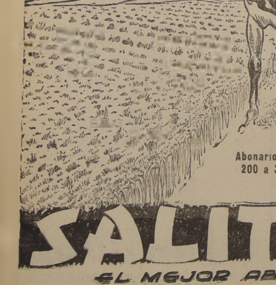
Abonarios cuanto antes con 200 a 300 kilos de salitre por cuadra.

ESTA MARCA FONOLITA ES SU GARANTIA. VENDEDOR FONOLITA. AGENTES: John Cameron Reid e Hijos. Teléfonos: 63340-66353. Agustinas 1070, Of. 131, Bgo.