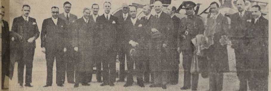
Miembros de la Misión Comercial de Canadá y personalidades, que le dieron la bienvenida a su llegada a Los Cerrillos.