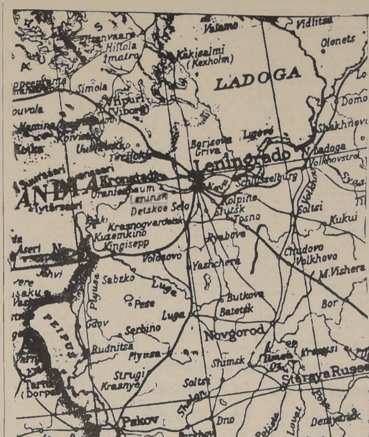
Mientras los alemanes progresan hacia el Lago Ladoga, los rusos han lanzado una poderosa contraofensiva, a fin de evitar que la ciudad de Leningrado sea totalmente cercada por los invasores. En opinión de voceros alemanes, la batalla por la posesión de la ex capital rusa será la más encarnizada de la presente guerra.

VIOLENCIA DE LA LUCHA Una indicación de la violencia de la lucha desde hace algunos días en este mismo frente, la ofrece la declaración de los mismos informantes, que manifestaron que el mismo cuerpo de ejército, entre los días 30 de agosto y 2 de septiembre destruyeron 178 tanques soviéticos, además de hacer 1.400 prisioneros y apoderarse de 107 cañones y gran cantidad de material bélico de todas clases.