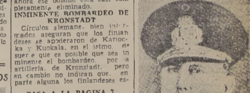
General Juan N. Tonazzi, Ministro de Guerra de la República Argentina.