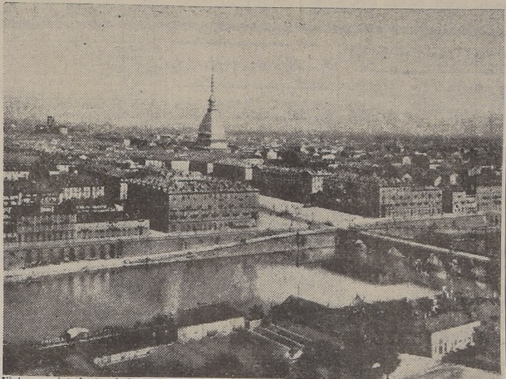
Vista parcial de la ciudad de Turin, que junto con Génova, sufrió uno de los ataques más intensos que en el curso de la guerra ha efectuado la Real Fuerza Aérea.

Este ataque contra el norte de Italia constituye uno de los más violentos de la guerra