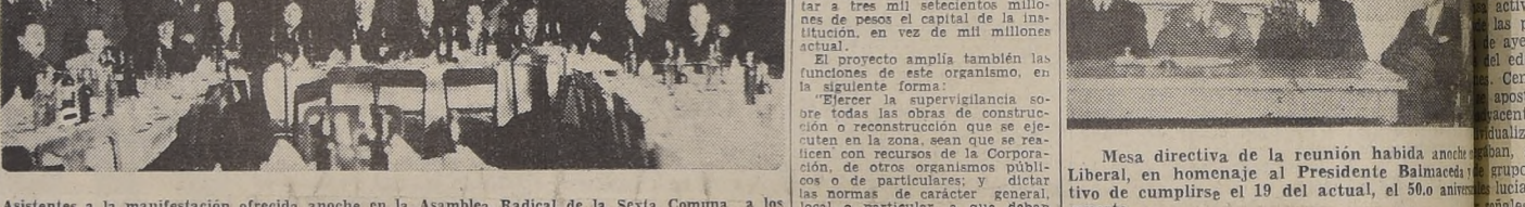
Asistentes a la manifestación ofrecida anoche en la Asamblea Radical de la Sexta Comuna a los presidentes de todas las asambleas comunales de Santiago...

SESIONES ESPECIALES TENDRAN EL LUNES EL SENADO Y LA CAMARA