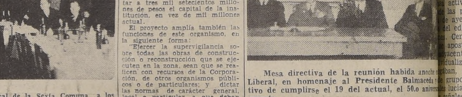
Mesa directiva de la reunión habida anoche en el Hotel Carrera...