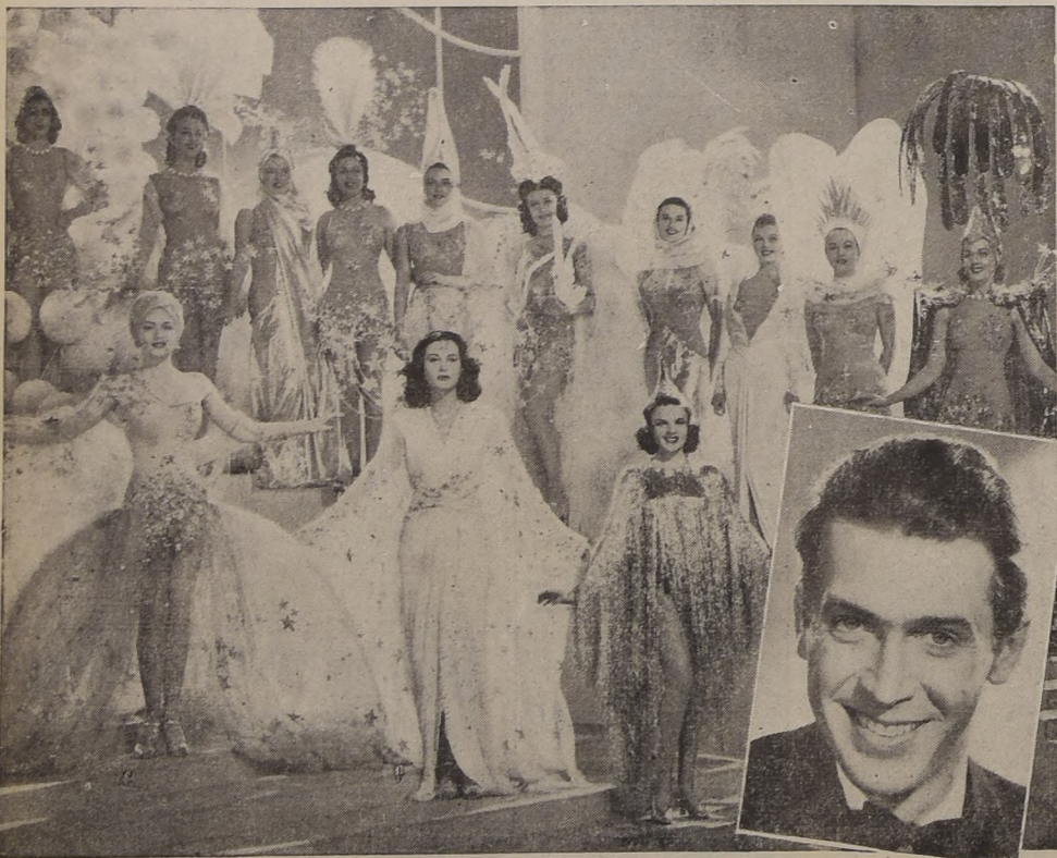
En un ángulo James Stewart, el principal intérprete de "Las Follies de Ziegfeld". En la escena del fondo se destacan Judy Garland, Hedy Lamarr y Lana Turner, las primeras figuras femeninas de esta gran producción Metro Goldwyn Mayer, que ha servido de inspiración para realizar el "Gran Concurso de Rumbas y Congas" que comenzará mañana en el salón de la Confeitería "LUCERNA".

Una combinación del Teatro Metro, la película "Las Follies de Ziegfeld", la Radio "La Americana" y el diario "La Nación", permitirá realizar una de las más alegres competencias de bailes modernos.—Valiosos premios, otorgados por importantes firmas comerciales de la capital, darán un mayor atractivo a este torneo de rumbas y congas que se efectuará en el "Lucerna". Escuche la Radio "La Americana", CB 130 onda larga y CB 960 onda corta, todos los días a las 18 y a las 21.30 horas y, en especial, el próximo Martes 16, a las 21.30 horas