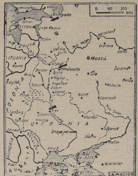
Las dos flechas de arriba indican la dirección en que los ejércitos rusos ejercen mayor presión sobre los invasores: Leningrado y Smolensk. La tercera, señala la posición geográfica de Kiev, ciudad que ha caído en poder de los alemanes, según informaciones procedentes de Berlín.

La lucha reviste caracteres de extrema violencia en las zonas de Kiev y Leningrado