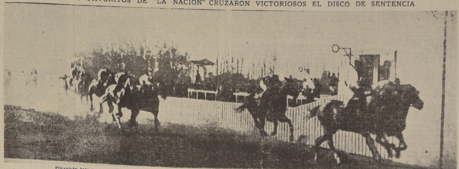
Pilcaniyén bate por una cabeza a Cap Ducal en el clásico "Pedro del Río Talavera".—Tercero a cuerpo y medio, se clasifica Chiloe, delante de Alcatraz y Faraón

CINCO FAVORITOS DE "LA NACION" CRUZARON VICTORIOSOS EL DISCO DE SENTENCIA