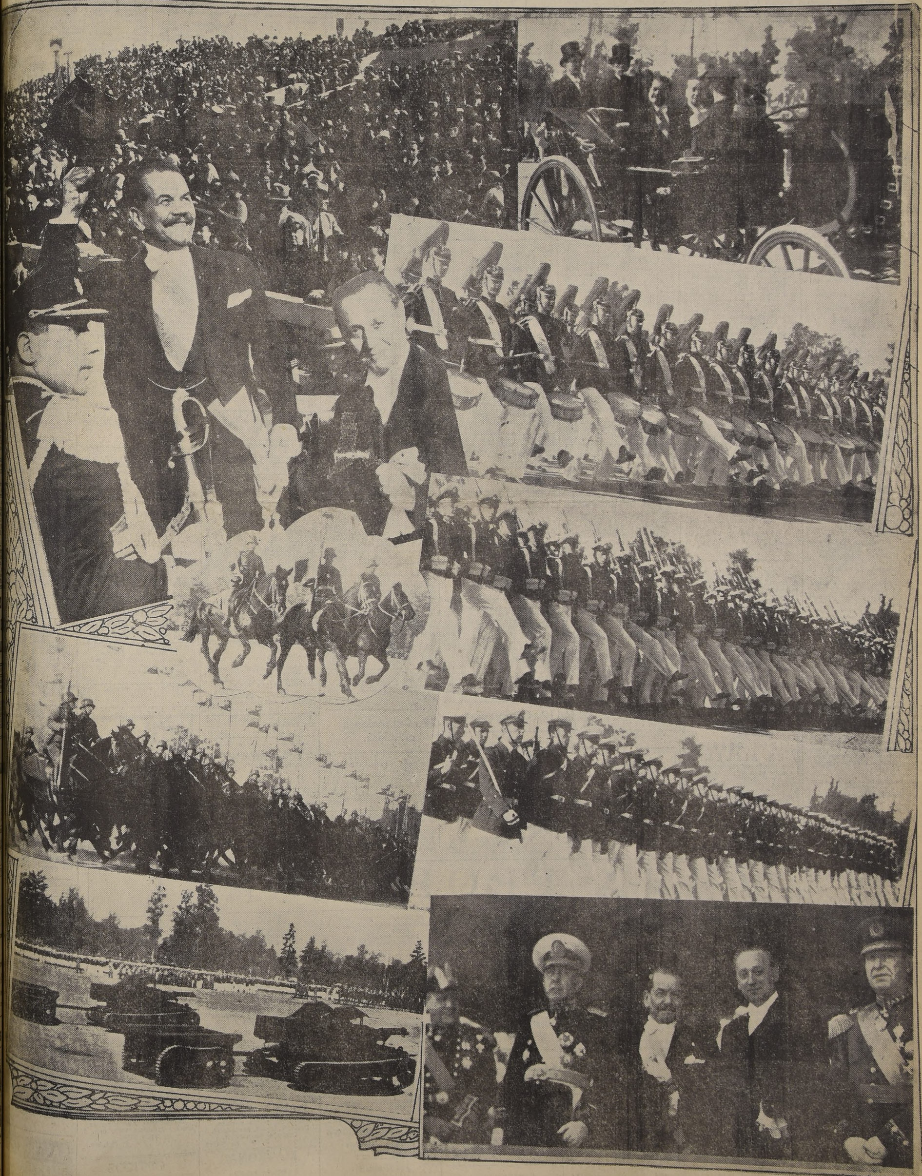
Este mosaico presenta diversos aspectos de la brillante presentación que hicieron ayer las Fuerzas Armadas en la Elipse del Parque Cousiño