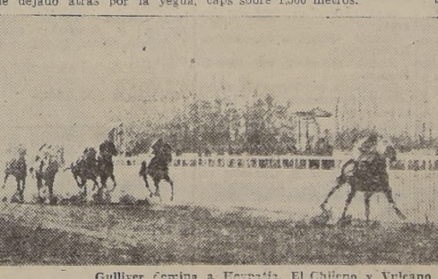
Gulliver gana a Hepatitis, El Chileno y Vulcanco