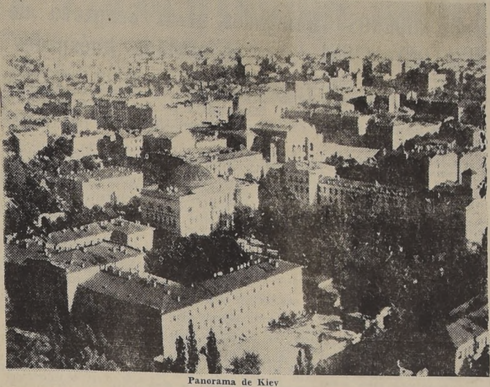
Panorama de Kiev

La toma de la capital de Ucrania deja cercados a los cuerpos de ejército del mariscal Budenny. AVANCES AL ESTE DEL RIO DNIEPER BERLIN, 19. (U. P.) — El comando alemán anunció ayer por medio de un comunicado que las tropas alemanas habían penetrado a la ciudad de Kiev, abriendo paso a las defensas exteriores de la ciudad alemana. Se agredió a la ciudad de Kiev. Se agredió a la ciudad de Kiev. Se agredió a la ciudad de Kiev.