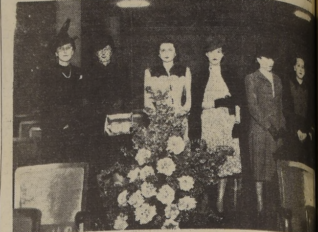
Al centro, frente al canastillo de flores, la dama que desde antaño es madrina del teatro Manuel Rodríguez.

CON UN COCKTAIL SE FESTEJO EL BAUTIZO DE AYESA