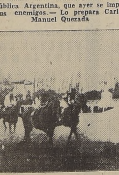
El empate cruzan el disco Carcamán y Disparate. Tercero El Cacique y cuarto Quillaco