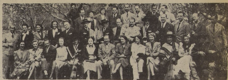
Asistentes al almuerzo de ayer en honor de Walt Disney