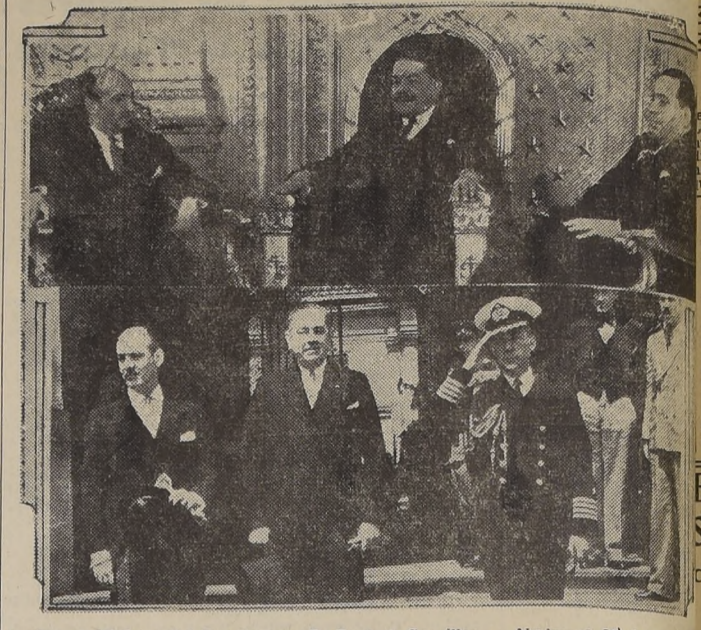
Arriba: el Ministro del Ecuador con S. E. y el Canciller.— Abajo: el Ministro del Paraguay se retira de la Moneda después de haber presentado sus credenciales