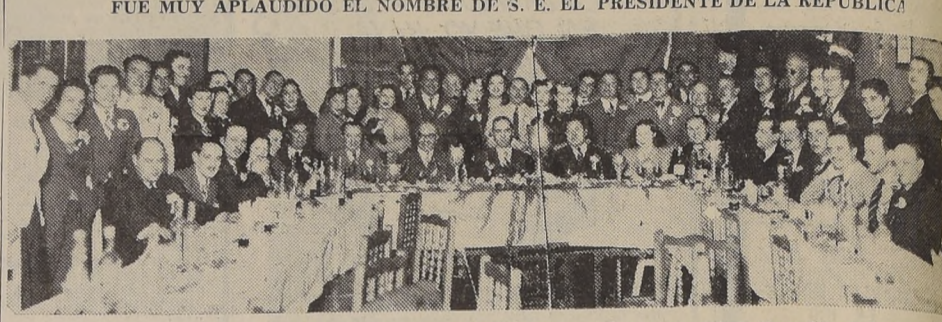
Aspectos de los asistentes a la manifestación, con que celebró brillantemente su tercer aniversario social el Centro Cultural Aguirre Cerda

FUE MUY APLAUDIDO EL NOMBRE DE S. E. EL PRESIDENTE DE LA REPUBLICA