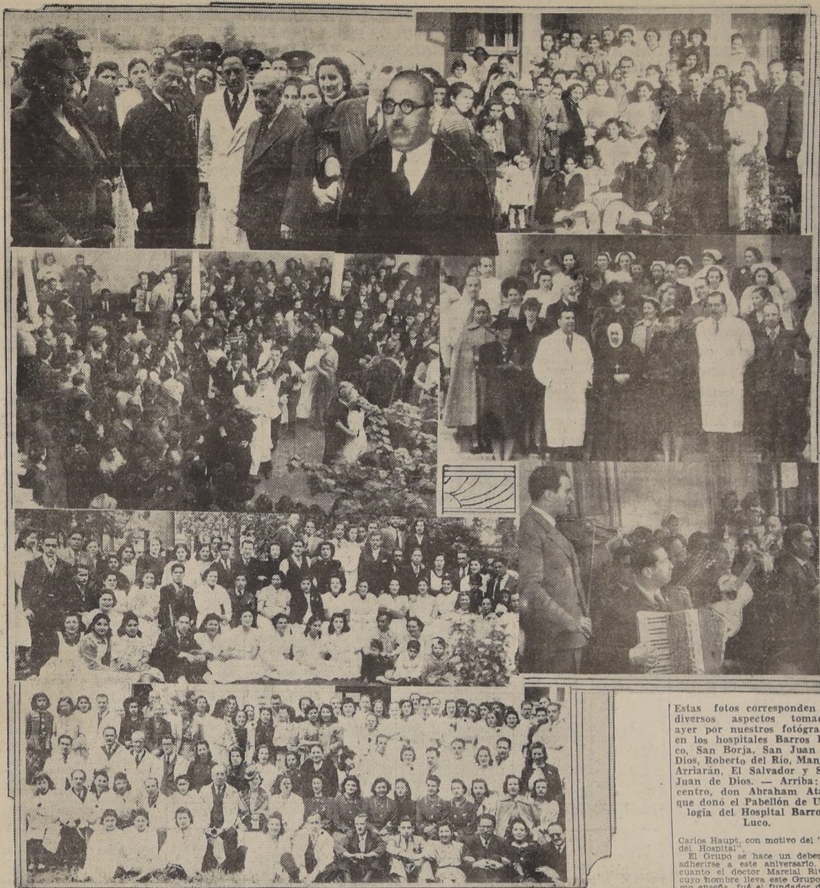
Estas fotos corresponden a diversos aspectos tomados ayer por nuestros fotógrafos en los hospitales Barros Luco, San Borja, San Juan de Dios, Roberto del Río, Manuel Arriarán, El Salvador y San Juan de los Ríos.

En el Hospital San Borja se celebró el curso del Embajador de los Estados Unidos. El acto estuvo presidido por el Excmo. señor Aguirre Cerda.