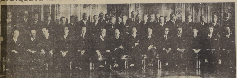
El banquete en honor de don Luis Gallo Porras, alcalde de la ciudad de Lima y ex presidente de la República, acompañado de su esposa y comitiva, fué objeto de reiteradas manifestaciones de simpatía por parte de los enfermos, empleados y público en general.