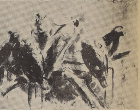
GRUPO SONOLIENTO. — Acuarela de Henry S. Keller

Es una tarde llena de sol, luminosa; los árboles del parque extienden sus enormes brazos a los rasgos acariciadores de este sol radiante de primavera; aquí hay un pequeño y erguido, que lanza todas sus baterías luminosas de botones y flores rojas, contra un cielo azurpurísimo: es una descarga cerrada de primavera.