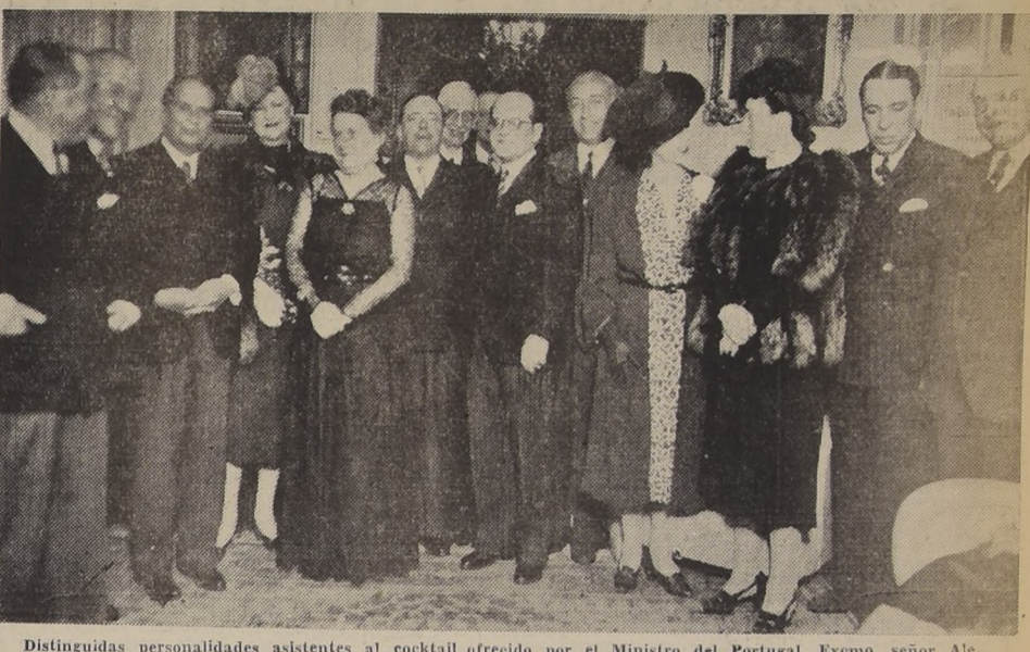
Distinguidas personalidades asistentes al cocktail ofrecido por el Ministro del Portugal, Excmo. señor Alejandro Ferraz de Andrada, y señora, con motivo de celebrar el aniversario de su patria.