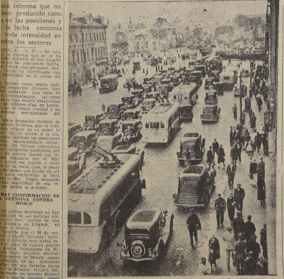
Vista de la Avenida Gorky en Moscú, capital de Rusia, en cuya dirección los alemanes concentran ahora sus esfuerzos.

En esta ocasión se expresa que no se ha producido durante el día ningún cambio en las posiciones militares. La lucha, continuó con toda intensidad en el curso del día. En esta ocasión se expresa que no se ha producido durante el día ningún cambio en las posiciones militares. La lucha, continuó con toda intensidad en el curso del día. En esta ocasión se expresa que no se ha producido durante el día ningún cambio en las posiciones militares. La lucha, continuó con toda intensidad en el curso del día.