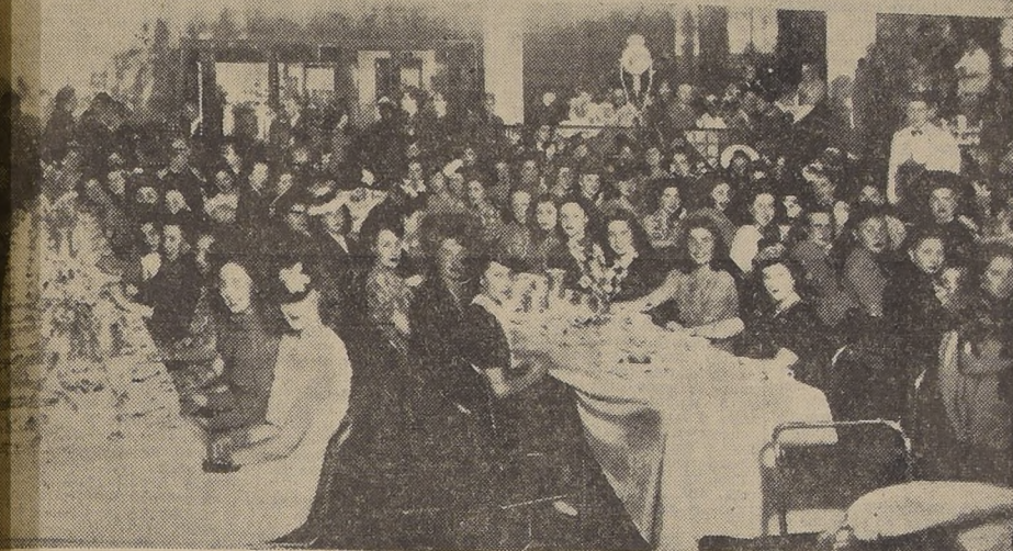
Profesoras y alumnas del Liceo N.º 1 se reúnen después de su día de placer al sur. — Para celebrar su feliz viaje, se sirvió un té en los salones de la Confitería LUCERNA.