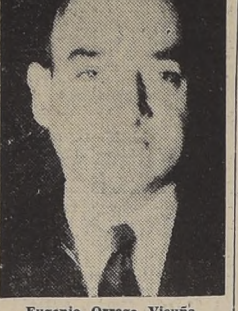
Eugenio Orrego Vicuña