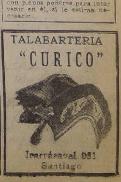
Inarrával 031 Santiago