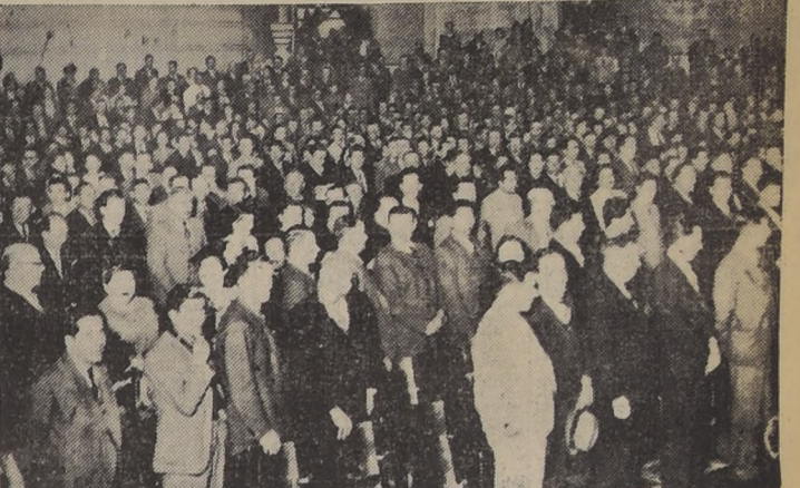
Parte de la numerosa concurrencia que asistió anoche al Teatro Caupolicán, a la concentración del comercio minorista de Santiago, en la cual se aborronaron interesantes problemas que interesan a este numeroso gremio