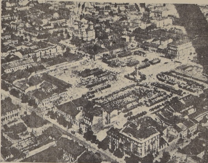
Vista del centro de Odessa, puerto ucraniano sobre el Mar Negro; tiene más de 400,000 habitantes y además de las actividades de su puerto, astilleros y diques de carén, posee varias fábricas de maquinarias agrícolas y de aviones y, después de una larga y heroica resistencia fué ocupada por las fuerzas germano-rumanas, según se anuncia desde Berlín

frente y ella pudiera significar el debilitamiento de alguna parte del frente. Existe en consecuencia, allí otra gran amenaza: la de que los alemanes logren cortar el camino por el cual se reciben al presente materiales de guerra británicos y norteamericanos. Pero con todo este negro cuadro, Rusia no está ni con mucho vencida. Tiene inmensas reservas humanas y materiales, y una decisión de luchar que posiblemente no tendrían los mismos alemanes en iguales condiciones. Nada se puede decir aún en concreto, porque nada hay en concreto y solamente resta esperar los acontecimientos de los próximos días que pueden estar plagados de sorpresas. ALLAN OSBORNE.