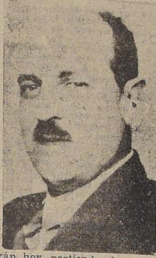
Sus funerales se efectuarán hoy, partiendo el cortejo desde su casa habitación...