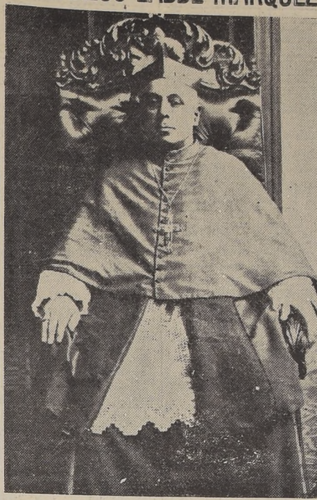
Monsiñor Carlos Labbe Marquez.

EL DECESO SE PRODUJO A LAS 10 HORAS EN LA CASA PARROQUIAL DE SAN RAMON, PROVOCANDO GENERAL SENTIMIENTO DE PESAR LOS RESTOS DE MONSEÑOR LABBE FUERON TRASLADADOS EN LA TARDE DE AYER A LA CATEDRAL, Y SERAN SEPULTADOS HOY, A LAS 10 HORAS SE LE RENDIRAN HONORES DE GENERAL DE DIVISION