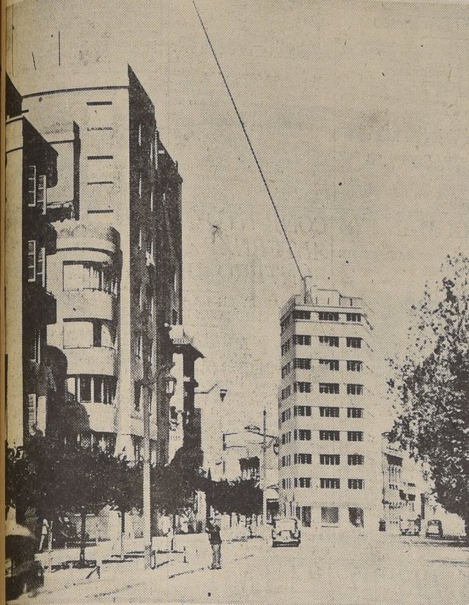
Interesante composición fotográfica, en la que se puede apreciar el aspecto que presentará este moderno y bien ubicado edificio

Hermoso y confortab'e edificio de departamentos se está construyendo frente al Parque Forestal