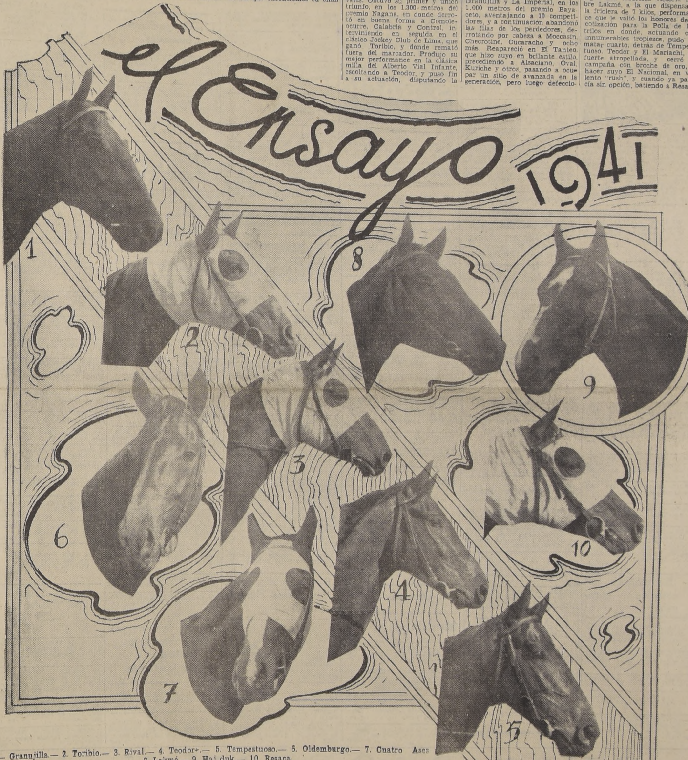
1.— Granujilla.— 2. Toribio.— 3. Rival.— 4. Teodor.— 5. Tempestuoso.— 6. Oldemburgo.— 7. Cuatro Ases.— 8. Lakmé.— 9. Hajduk.— 10. Resaca.

TORIBIO 56, F. Santander. — Hizo sus primeras armas en el Sporting, iniciándose con un fácil triunfo sobre Contrasantido, Kurihue, La Real y 16 adversarios más, en los 800 metros del premio Itch. Traído a Santiago, disputó el clásico Jockey Club de Lima, en donde alcanzó una nueva victoria, derrotando a La Real, Bellaco, Oval y otros, performance que le valió los honores del favoritismo para el Roberto Vial Souper, en donde se midió con la guardia vieja, fracasando sin atenuantes, pues no figuró en tabla. Sometido a descanso, reapareció en la milla del premio Zolka, en donde obligó a emplearse a fondo a un elemento de la talla de Bolidero, para aventajarlo por un pesoque a la llegada, actuación que le daba sobrados títulos para enfrentarse en la Polla con el mejor de la generación, pero ahí sufrió un