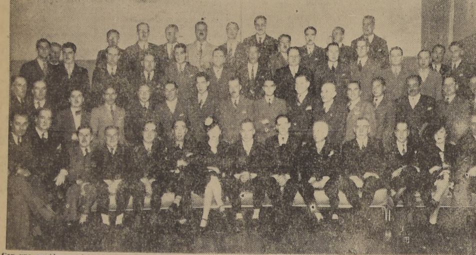
Con una comida especial fue celebrado el 25 aniversario de la Sociedad de Empleados de Bancos y Cajas. Especialmente invitadas asistieron los Gerentes de Instituciones Bancarias y Cajas de Seguros. Se sirvió en el Salón de Recepciones del LUCERNA